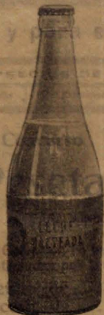
Leche Malteada Lactancia artificial. Lo mejor para régimen lácteo en adultos