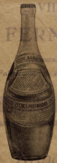
Leche Anasérica Tratamiento dietético, fiebres tíficas, para-tíficas y coli-bacilares