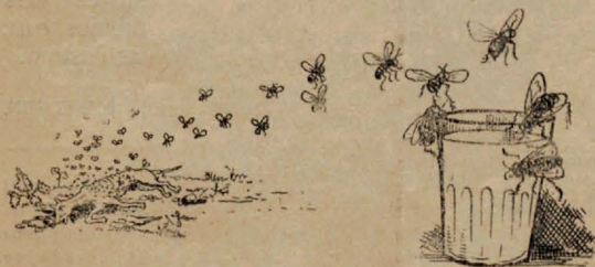
De un perro muerto al vaso de leche del niño. Este dibujo demuestra gráficamente la repugnancia que deben inspirar las moscas.

Aquí en España, la Sanidad oficial ha editado en estos últimos años unos carteles murales de guerra a las moscas.