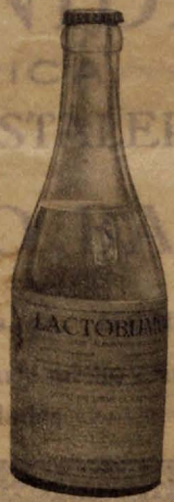
Lactobúmosa Leche albuminosa malto- sada. Tratamiento de gas- tro-enteritis infantiles.