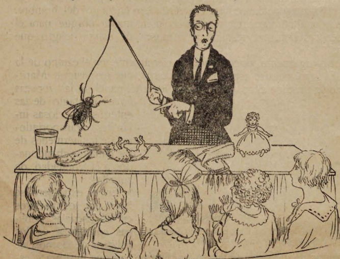
Una lección gráfica sobre los peligros de la mosca.

El profesor muestra a los niños una mosca gigante que mancha sus patas en un animal muerto y luego revolotea hacia el pan y el vaso de alimento del niño.