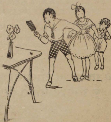
Los niños convencidos del peligro de las moscas, procuran destruirlas por todos los medios.

Pero el primer paso es la enseñanza al público de los peligros de la mosca,