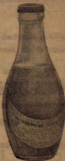
Lactobumosa Botellines para pequeñas dosificaciones.