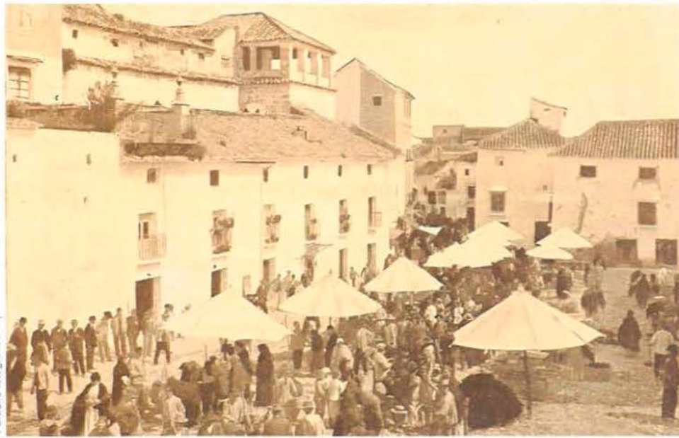
Foto retrospectiva del viejo mercado lucentino aledaño al Coso, con sus características sombrillas blancas protectoras del sol.

las influencias y la propaganda de republicanos, socialistas y sindicalistas. Destaca en este punto el relativo —aunque minoritario— arraigo de los postulados de Pablo Iglesias, pues, como es conocido, estuvieron poco extendidos en tierras campiñesas a la altura de principios de siglo. El 30 de junio de 1908 fue fundada la Agrupación So-