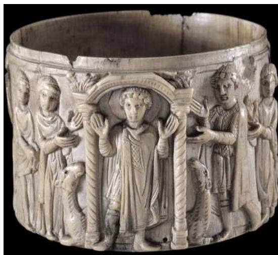
Fig. 6. Pyxis de marfil con San Menas, Londres/BM M&ME 1879.12-20.1

forma más evidente, el contraste iconográfico con la imagen-tipo de “Horus sobre los cocodrilos”.