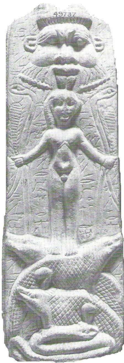
Fig. 4. Londres/BM 49737

como por el propio papel que desempeña este animal en los hechos de San Menas.