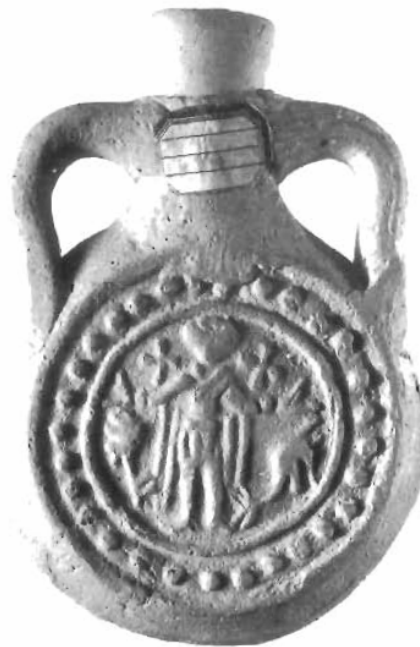
Fig. 5. Madrid/MAN 1876/6/1159

Desde mi punto de vista, la tesis defendida por algunos egiptólogos que defiende la relación directa entre la imagen de Horus y la de San Menas no tiene sustento posible, como resulta evidente. Pienso que, probablemente, los ejemplos de ampullae bastante deteriorados, o bien aquellos realizados de manera más tosca en los que resulta complicado distinguir los elementos que están representados, pueden llegar a confundir al observador, y de