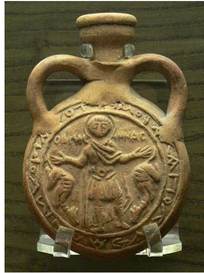
Fig. 2. Louvre AGR MN 146 23