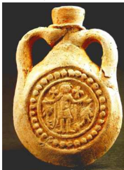
Fig. 1. Lisboa BSA.987.55.125 22

En muchos casos la imagen suele ir acompañada de una inscripción, que bien puede ir situada dentro del medallón, generalmente sobre los brazos del santo, aunque también aparece inserta en la gráfila que rodea la imagen de Menas, como ocurre en la fig. 2. Las inscripción más común que acompaña este tipo de imágenes es ΕΥΛΟΓΙΑ ΤΟΥ ΑΓΙΟΥ ΜΗΝΑ, la forma contraída ΤΟΥ ΑΓΙΟΥ ΜΗΝΑ, o bien otra fórmula más elaborada que la anterior, a saber: ΕΥΛΟΓΙΑ ΛΑΒΟΜΕ[Ν] ΤΟΥ ΑΓΙΟΥ ΜΗΝΑ 21 . Por lo tanto se trata, explícitamente, de las εὐλογία (bendiciones, o agua bendita) del santo.