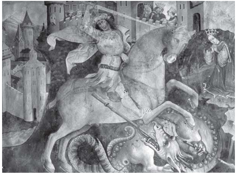
St. George fighting the dragon Thomas of Villach (c. 1435-c. 1529)

Aquí la referencia intertextual es más callada, de mayor calma y resignación: «Atravieso el ahora / con la lanza / de mi propia ausencia: / quiero dejar de ser / o ser solo reposo / abandono / al vacío del alma / que a la nada aspira / ni a la espera / que no espera» (p. 67). Al llegar al final de este viaje, Janés hace una referencia final a San Jorge matando al dragón de destrucción («el dragón agoniza») para que la belleza y el misterio puedan prevalecer, a pesar de todo.