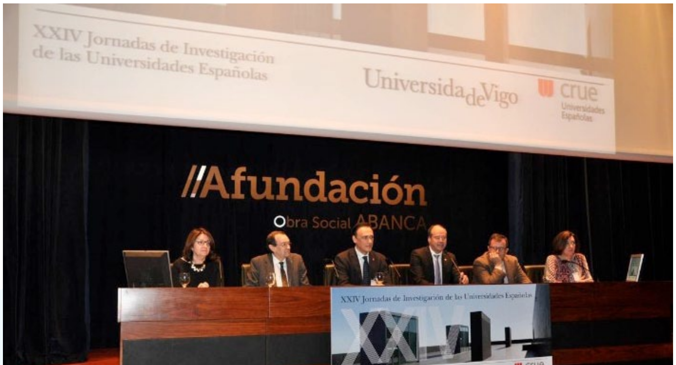
Mesa inaugural de las XXIV Jornadas de Investigación de las Universidades Españolas.

La Comisión analizó también los instrumentos de colaboración Universidad-Empresa, así como los indicadores y métodos de evaluación de la transferencia de conocimiento.