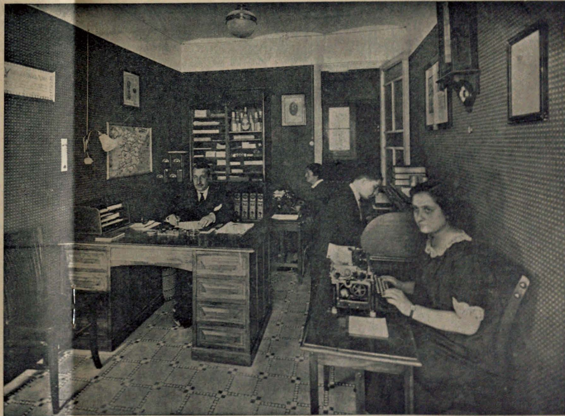
BARCELONA.—Oficina de la Sucursal en dicha ciudad del Laboratorio de Leches Preparadas, de Córdoba.

Habló después de como a lo largo de los siglos los espíritus selectos, caritativos y nobles, encauzados por la ci-