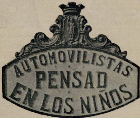
Letrero hecho por la Junta de Protección a la Infancia de Gijón y colocado en las principales carreteras de Asturias, conlindo en que las demás Juntas secundará esta iniciativa del Vocal del Consejo Supremo, nuestro ilustre amigo, Dr. Velasco Pajares.

el tiempo fijado por el médico del establecimiento y trabajar en la medida de sus fuerzas. El art. II dice, que las mujeres admitidas solamente deben declarar su estado civil al médico que por su secreto profesional se reservará en absoluto. Se las que no quieran revelar su nombre, se les asignará un número con el cual se le conocerá durante el internado.