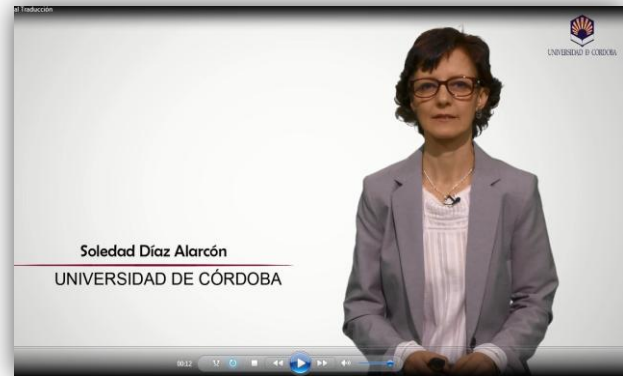
8. Imágenes de vídeos Análisis y Traducción de texto jurídico-económico (FR>ES) y Análisis y Traducción de texto humanístico-literario (FR>ES)

En cuanto a los resultados que esperábamos al inicio del proyecto, mencionamos los siguientes logros: