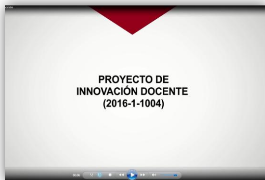
6. Imagen vídeo Presentación del Proyecto de Innovación Docente (2016-1-11004)

De este modo, se han realizado un total de 9 vídeos: una introducción, que justifica la creación del manual y 8 vídeos que se corresponden con la explicación de los textos elegidos por los respectivos docentes, analizados y traducidos al español. Textos que parten de las lenguas francesa e inglesa, así como un vídeo final que reúne un compendio bibliográfico de material didáctico de gran interés para el trabajo autónomo del alumno.