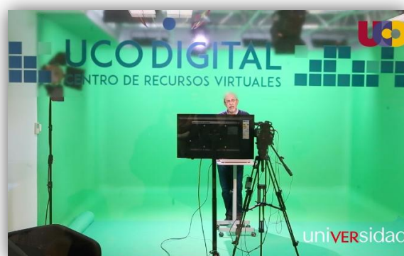
1. Instalaciones y equipos de UCODIGITAL (Campus de Rabanales)