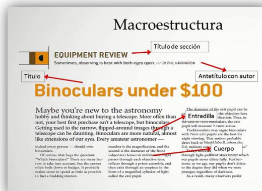
4. Traducción técnica (EN>ES)