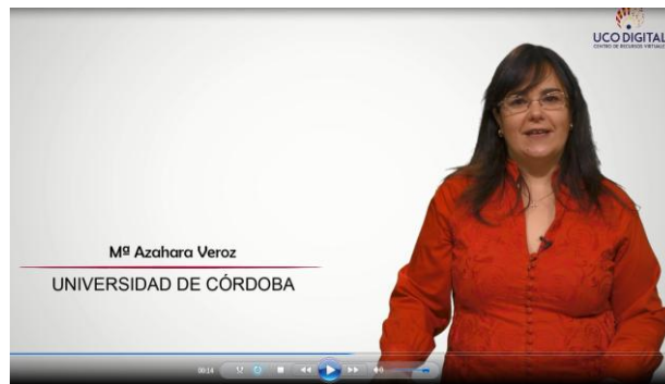
7. Prueba de vídeo Análisis y Traducción de texto científico-técnico (EN>ES)