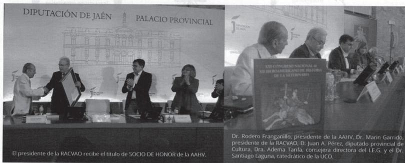
El presidente de la RACVAO recibe el título de SOCIO DE HONOR de la AAHV.