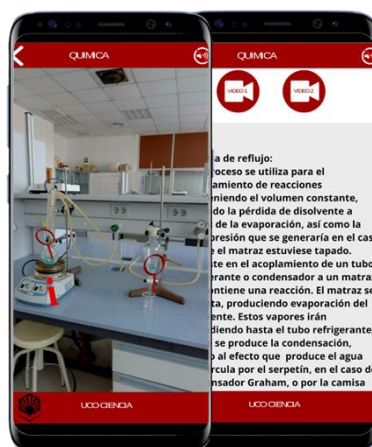
IMAGEN 6. Laboratorio virtual de Química

La Imagen 6 muestra diferentes montajes que se usan en una sesión práctica en el laboratorio de química así como los enlaces a videos explicativos.