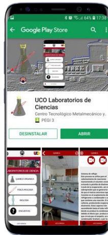
IMAGEN 4. Pantalla de descarga de la aplicación en Google Play Store

“UCO- Laboratorios de Ciencia” está disponible en Google Play Store ( https://play.google.com/store/apps/details?id=com.CETEMET.uco ) (Imagen 4). Su diseño es muy sencillo, lo que permite que sea ideal para su uso en la enseñanza. Además, la aplicación es muy intuitiva ya que permite la navegación por cada uno de los laboratorios sin dificultad.