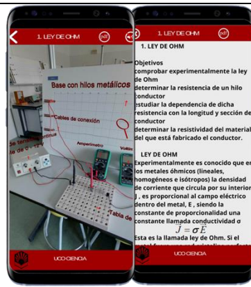
IMAGEN 7. Laboratorio virtual de Física aplicada

En la Imagen 8, se muestra uno de los equipos de genética molecular dentro del laboratorio virtual de Biología.