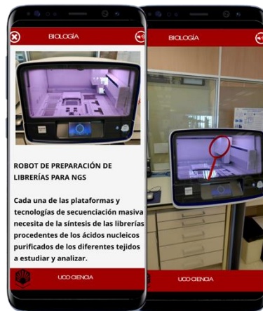
IMAGEN 8. Laboratorio virtual de Biología

En la Imagen 8, se muestra uno de los equipos de genética molecular dentro del laboratorio virtual de Biología.