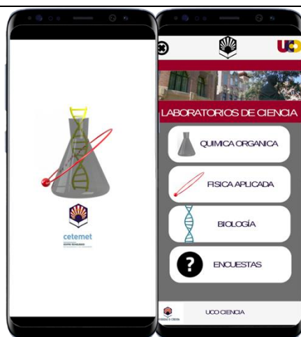
IMAGEN 5. a) Captura de pantalla de “Splash” b) Pantalla del menú principal.

Cada laboratorio presenta un recorrido virtual de 360° donde van apareciendo los diferentes instrumentos y aparatos que se utilizan habitualmente en cada uno de los laboratorios. Cada uno de los aparatos o instrumentos posee una descripción (texto, video o descripción de su uso durante la práctica) y utilidades a la que se accede pulsando sobre el dibujo de una lupa que aparece encima de la imagen del aparato o instrumento.