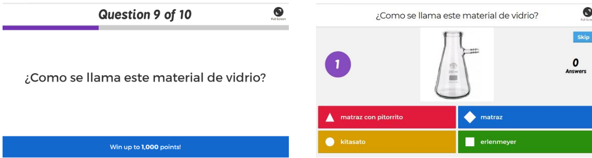
IMAGEN 3. Ejemplo de pregunta realizada con Kahoot.