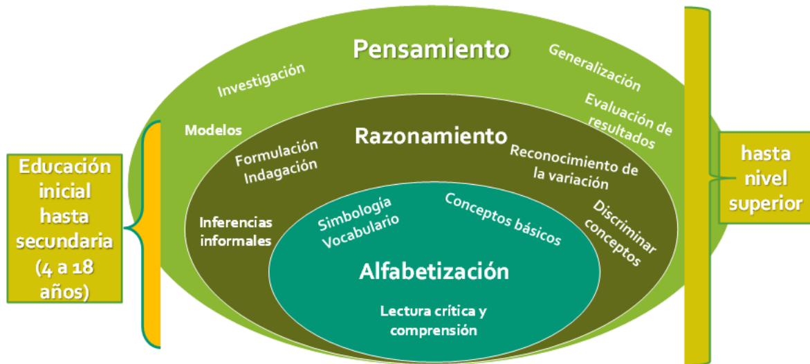
Figura 1. Componentes de la Educación Estocástica

Sumado a esto, cuanto más significativas sean esas complementariedades, más robusto será el núcleo del pensamiento estadístico. Consideramos que esa significatividad se dará paulatinamente a través de establecer relaciones cada vez más complejas entre las IEF (Santellán, 2019).