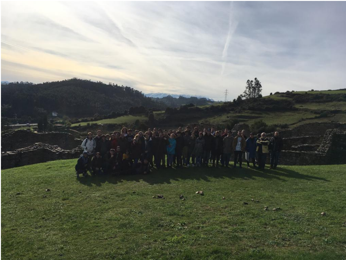
Figura 4. Visita a la villa romana de Veranes realizada el 19 de noviembre de 2019.