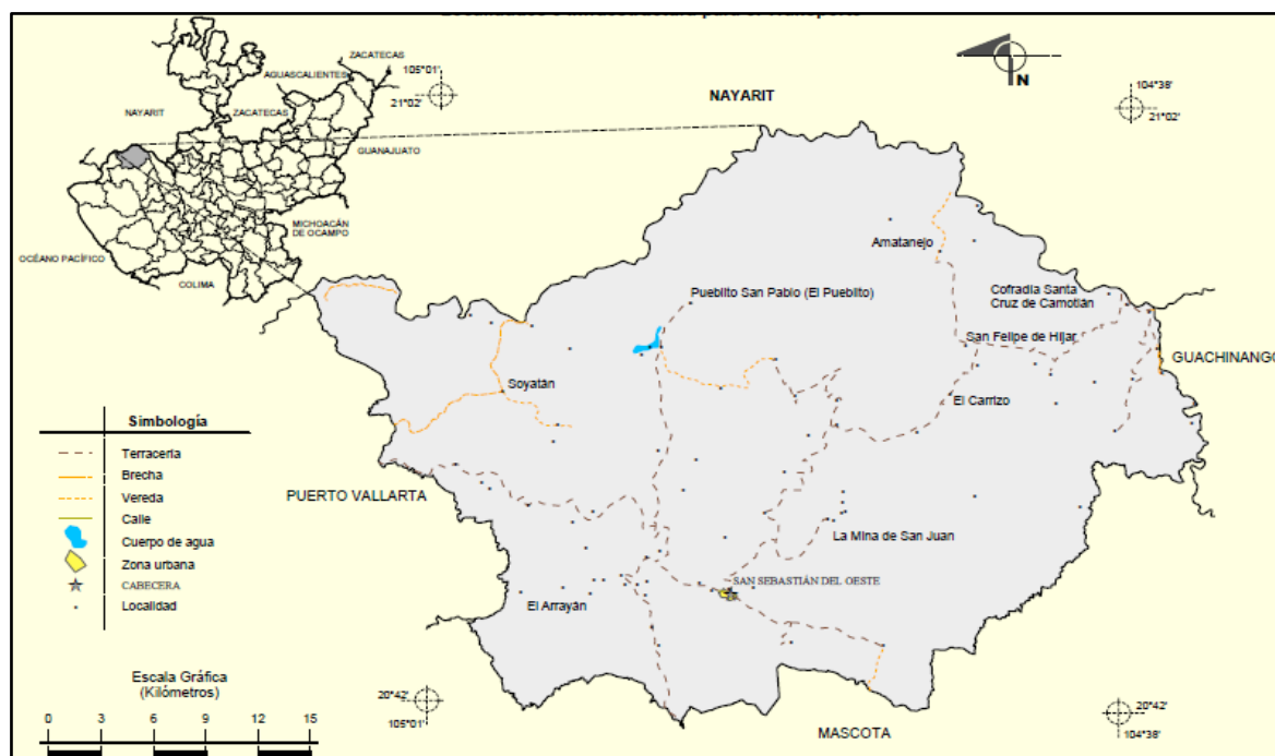
Figura 2. Localización del municipio de San Sebastián del Oeste, Jalisco, México