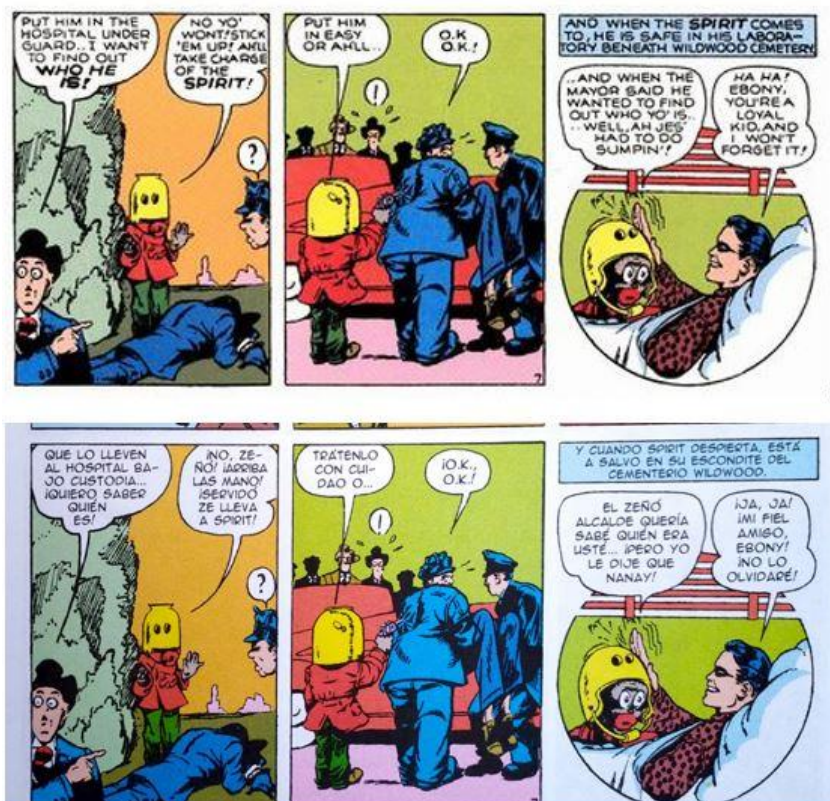
Figura 8. Ebony salva a Spirit

Fuente: Eisner (2000, p. 83) y Sánchez Abulí (2005b, p. 13)