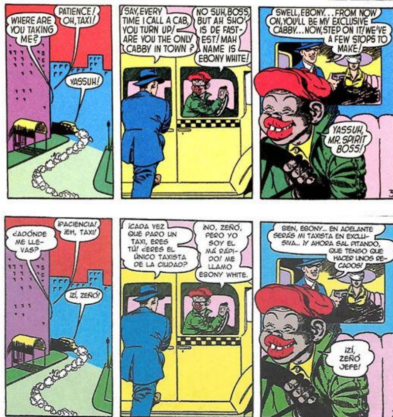
Figura 6. Ebony White se presenta