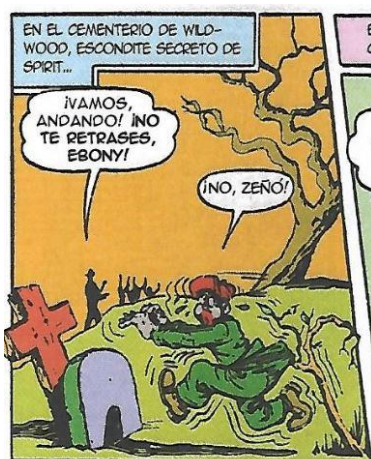
Figura 2. Ebony, el asustadizo

ayudar al protagonista a combatir a los malhechores, lo cual evoluciona en la relación paternofilial que se establece entre ambos y se convierte en una de las constantes del cómic. Ebony se muda a la guarida del cementerio de Wildwood en calidad de pupilo de Spirit, quien lo educa y le lee cuentos.