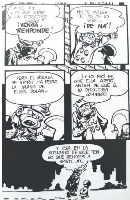
Figura 9. El dialecto de Ebony en la traducción de Macía y Pérez Navarro

La imagen de Ebony White en los cómics del justiciero enmascarado The Spirit es, cuando menos, problemática. Se lo representa como a un joven negro de ojos saltones, gruesos labios rojos y orejas de soplillo que lleva un traje de botones, aunque en realidad trabaja de taxista. Siempre está dispuesto a ayudar al héroe protagonista y su personalidad asustadiza y servil demuestra que la imagen Ebony en los cómics de Will Eisner se ajusta al estereotipo racial de tío Tom que extendieron los minstrel shows del siglo XIX. Aunque con fines cómicos y paródicos, los bocadillos del personaje reflejan, mediante la técnica del dialecto visual, algunos rasgos morfosintácticos y fonológicos característicos del inglés afroamericano, caso de las preguntas sin auxiliares verbales, la conjugación verbal marcada o la pronunciación que no se ajusta a la norma culta.