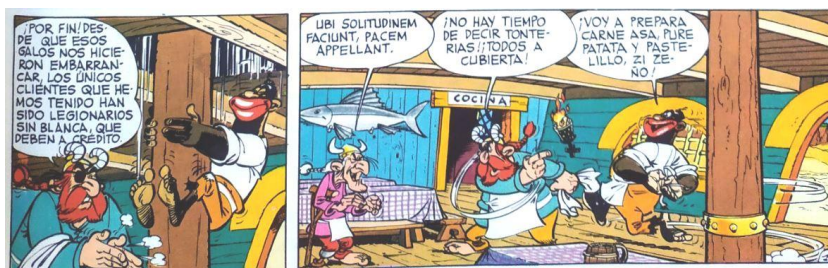
Figura 3. Baba en Astérix

Incluso el nombre parlante del personaje, que literalmente significa «ébano blanco», acentúa la representación estereotípica de Ebony White. Su aspecto exagerado y su habla marcada lo conectan con el retrato de los personajes afroamericanos que ofrecía el vodevil, en concreto los minstrel shows , los espectáculos de variedades que surgieron en la década de 1830 con actores blancos que se pintaban de negro y se mofaban de los esclavos, a quienes tachaban de vagos, supersticiosos y patanes (Carpio, 2008, p. 23). Algunos de estos rasgos se aprecian en Ebony, ya que el joven es torpe, se asusta a menudo y se enamora con facilidad, si bien la chica a la que corteja siempre le da calabazas, como sucede en la historieta «As Ever Orange», que se ambienta en San Valentín y data del diez de febrero de 1946. A medida que The Spirit progresa, Ebony emprende sus propias aventuras, pero como es un patán y un alivio cómico, el protagonista siempre ha de acudir en su ayuda y salvarlo en el último momento. Así sucede en «El caso del estornudo eterno», el cómic del seis de febrero de 1949 en el que el joven abre su propia agencia de detectives privados, lo cual desemboca en una parodia alocada de las novelas de Raymond Chandler protagonizadas por Philip Marlowe.