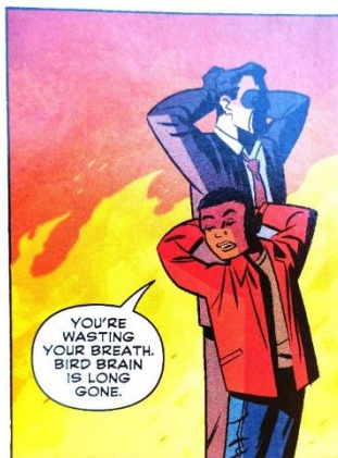
Figura 10. La nueva versión de Ebony.