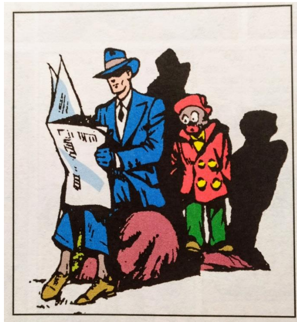
Figura 1. Spirit y Ebony White. Fuente: Sánchez Abulí (2005a, p. 56)

La Figura 1 muestra que Ebony White es un joven negro, poco más que un niño. Viste un uniforme de botones de hotel, holgado y rojo. Tiene los ojos saltones, las orejas de soplillo y los labios gruesos y del mismo rojo intenso que el traje y la gorra. Su representación resulta, cuando menos, controvertida, sobre todo para los lectores de principios del siglo XXI. Se corresponde con el estereotipo del negro servil, también presente en el cine y la televisión estadounidenses de la primera mitad del siglo XX, que retrataba a los afroamericanos como si fueran bufones de comportamiento adulator, con ojos saltones y pelo de punta, cuyas payasadas perseguían el fin de entretener a los espectadores (Bogle, 1997, p. 7). Como apunta Hayes (2015, p. 296), el retrato que Eisner ofrece de Ebony White se ajusta a los estereotipos raciales peyorativos sobre los afroamericanos que mostraban los medios de masas de la década de 1940. En sus primeras apariciones, Ebony es servil y está encantado de complacer a los clientes blancos, como el comisario y Spirit. Los lleva donde le pidan sin rechistar. Además de bienintencionado, el joven es un poco patoso cuando intenta