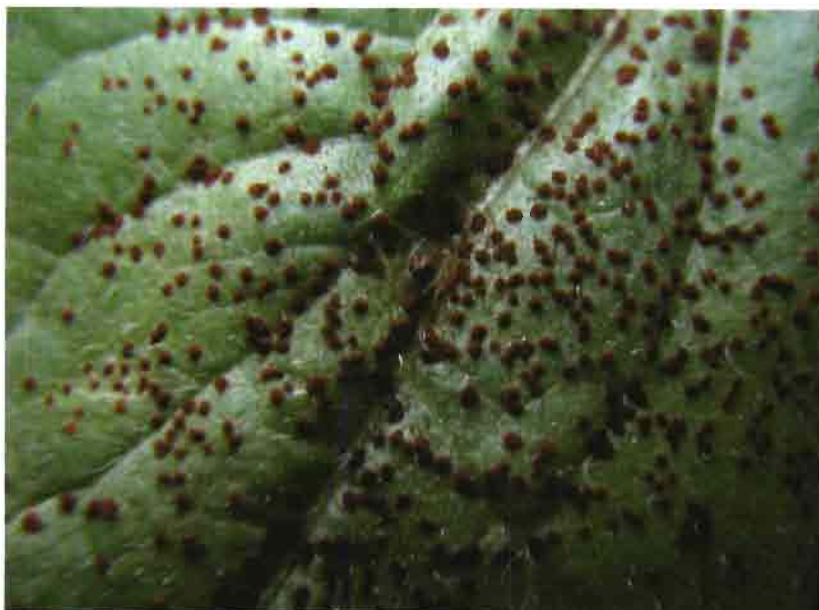
Pústulas sobre el haz de una hoja de girasol.

Puccinia helianthi es un hongo que completa todo su ciclo en un solo huésped a diferencia de otras royas que requieren un huésped alternante para desarrollar en él algunas fases de su ciclo biológico. Podemos encontrar las esporas de este hongo en cinco estadios según el momento de su ciclo biológico. La roya puede permanecer viable en uno o dos de estos estadios hasta la infección de la planta. Las bajas temperaturas y los días cortos desencadenan la producción de estructuras que permiten al hon-