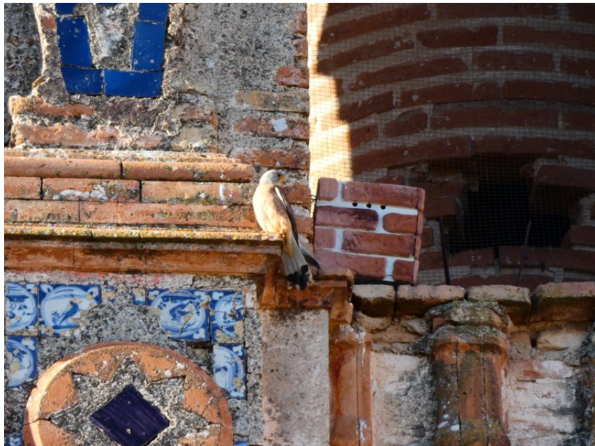
Cernícalo primilla macho junto a una caja nido tematizada en la torre de la Iglesia de la Asunción de Palma del Río (Córdoba)