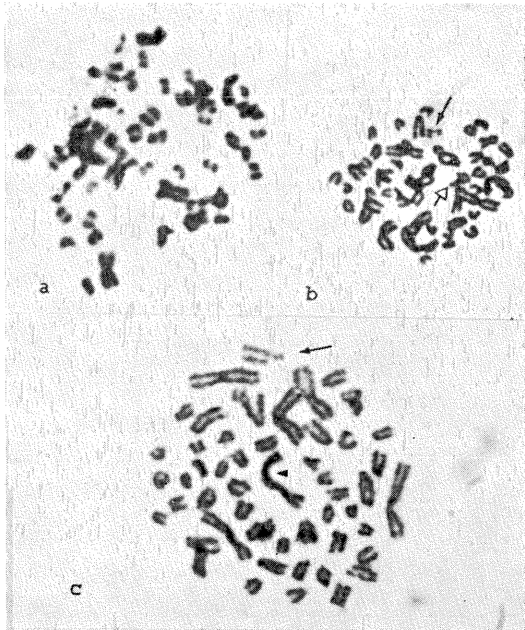
Fig. 2 Cromosomas de oveja tratados con 2, 4, 5-T. a Metafase con fragmentaciones cromosómicas. b Rotura (→) y deleción (←) de cromátidas. c Rotura (→) y fusión de cromátidas homólogas (▶).