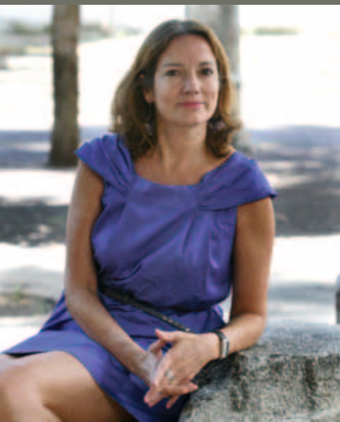
ANABEL CARRILLO LAFUENTE PRESIDENTA DEL CONSEJO SOCIAL DE LA UNIVERSIDAD DE CÓRDOBA