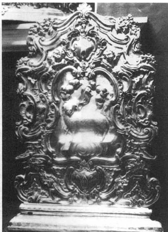
Viso del Sagrario (1789)