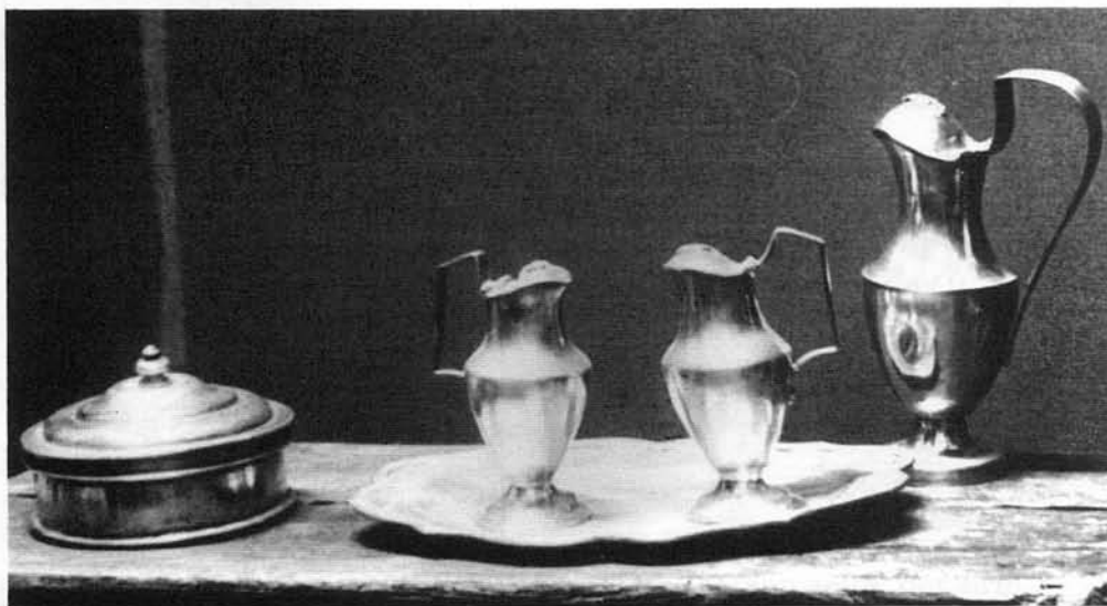
Vinajeras y Ostiario (1765)