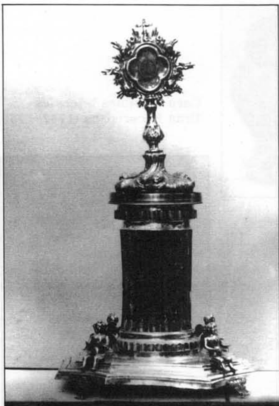
Relicario (1759) Soporte neoclásico. Francisco González