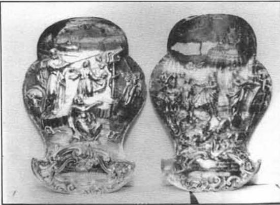
Cara movibles laterales Urna Eucarística (1747-1765)