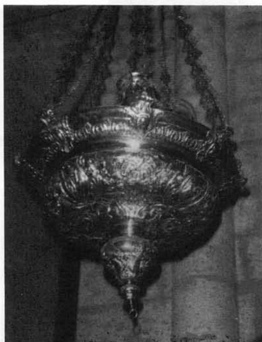
Lámpara de Altar (1780)