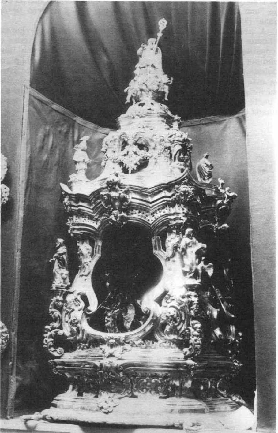
Urna Eucarística (1747-1765)