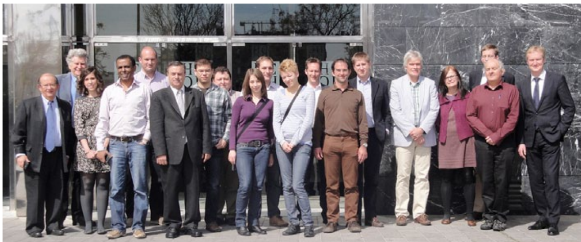
Grupo de trabajo de Instant Project

dora, de bajo coste y sencilla que nos permita extraer, detectar e identificar nanopartículas en matrices complejas, ya sea en productos alimenticios (sopas instantáneas, ketchup, helados,...), bebidas (zumos de fruta, bebidas energéticas, agua embotellada,...) como principalmente cosméticos (cremas de dientes, cremas de la cara y el cuerpo, desodorante,...).