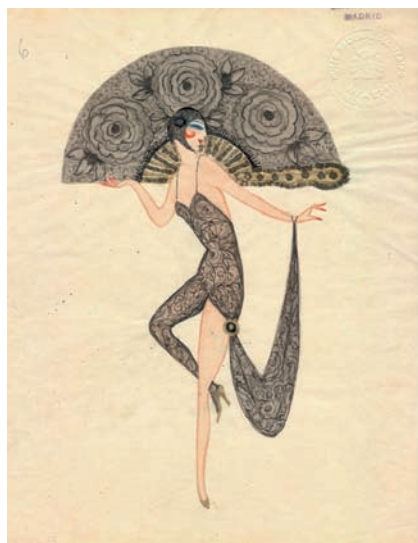
Fig. 7. Figurín de Álvaro Retana.

No son pocos los beneficios de estar despierto, sobre todo cuando se trata de asistir a la renovación y el refinamiento del género frívolo a través de la obras pictóricas y literarias de Zamora y Retana, unas creaciones que buscaban retratar una belleza joven y andrógina envuelta en bastantes ocasiones en un velo de exotismo orientalista [Figs. 7 y 8]: