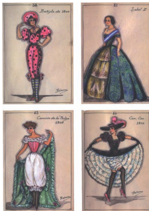
Fig. 11. Figurines de Álvaro Retana adquiridos por la BNE.