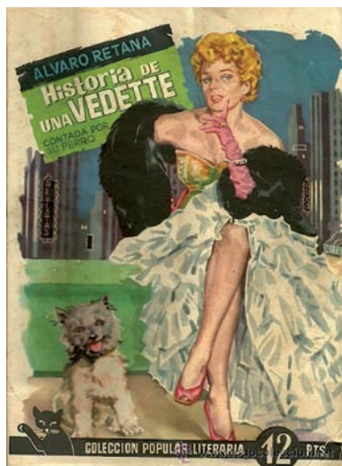
Fig. 5. Historia de una vedette contada por su perro .

Ante la acusación del fiscal de que usaba un copón bendito para beber semen de sus amantes, Retana hace gala de un aplomo y un sentido del humor que jamás le abandonarían y contesta: “Señor, prefiero siempre tomarlo directamente” 16 . Tras aplazar varias veces su ejecución, se le conmutó por treinta años de cárcel, de los que cumplió prácticamente una década; puesto en libertad y recuperado su empleo en el tribunal de cuentas en el año 1957, Álvaro continuó con sus múltiples actividades, que no había abandonado en prisión, e incluso vivió un pequeño renacer con el taquillazo de El último cuplé . También volvió a publicar ensayos sobre el género que tan bien dominaba como: Estrellas del cuplé o Estrellas del arte frívolo , además del ensayo Historia del arte frívolo y una novela de las que tanto gustaban en su juventud, como Historia de una vedette contada por su perro (1954) [Fig. 5], si bien en 1970, habiendo cambiado su más que saqueada mansión, por una humilde buhardilla en el madrileño barrio de San Bernardo, murió –cuentan que asesinado por un chulo– 17 , pero sobre