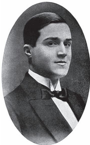
Fig. 1. Autorretrato de Retana aparecido en Historia del arte frívolo , 1964.

Esta etopeya rojiverde, que da buena cuenta del carácter multidisciplinar del artista, viene motivada por la contemplación desde la senectud de un autorretrato [Fig. 1] de sus inicios literarios en El Heraldo de Madrid , cuando contaba con 21 años de edad –o 13– si atendemos a las biografías falseadas incluidas en la contraportada de algunas de sus novelas, que retrasaban a 1898 el año natalicio. Los cuentos galantes y las crónicas subidas de tono que publicaba bajo el heterónimo de la joven francesa Claudina Regnier en revistas y periódicos satíricos como El Gran Bufón , Madrid cómico o La Hoja de Parra y las novelitas que nutrían las, por entonces muy populares, colecciones de narrativa breve, no solo hicieron enrojecer a las mentes más morigeradas, sino que pusieron verdes de envidia a los “Unamunos”, que así llamaba Retana a los escritores más preclaros del 98.