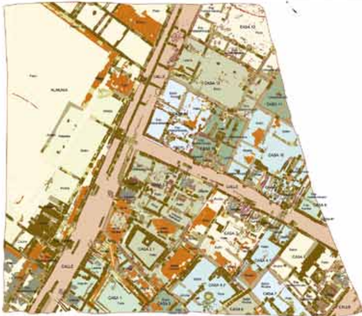
0 2 4 6 8 10 metros