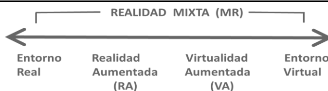
Figura 1. Imagen traducida de http://www.realitytechnologies.com/mixed-reality

Moralejo (2014) menciona que el término Realidad Aumentada fue acuñado en el año de 1990 por Tom Caudell, y señala que los requerimientos técnicos de esa época -computadoras y equipos especiales, cámaras especiales, software limitado- mantuvieron esta tecnología fuera del alcance de la mayor parte de los usuarios. Sin embargo, a partir de dicha época se han realizado diferentes investigaciones y desarrollos sobre esta tecnología, tales como: