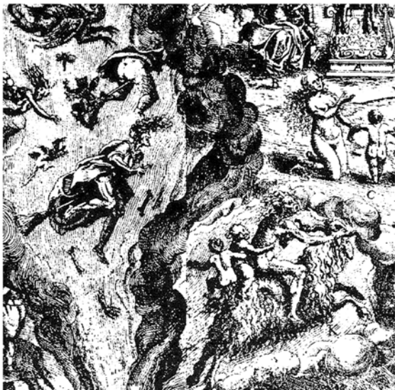
Parte central superior del grabado de Jan Ziarnko en el Tableau de l'Inconstance des mauvais anges et démons. Où il est amplement traité des sorciers, et de la sorcellerie , de Pierre de Lancre (París, Nicolás Buon, 1613, IV, 2, fol. 118-119).

a estos, Vitoria, Azpilcueta, Suárez y Pedro de Valencia 136 querían volver a la letra del texto más autorizado, el medieval y apócrifo Canon Episcopi 137 , que había enunciado siglos antes la índole ilusoria (aunque sí a veces diabólica) de la “cabalgata nocturna” de mujeres 138 .