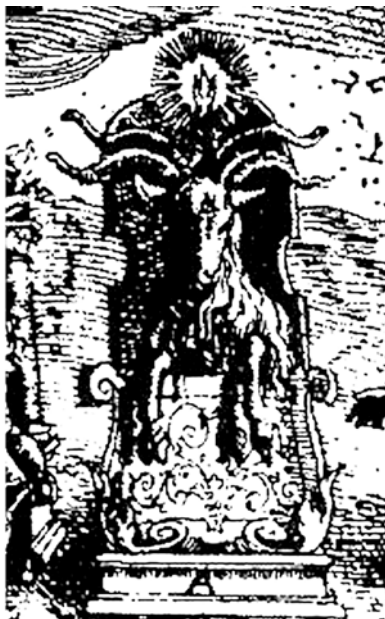
Parte superior derecha del grabado de Jan Ziarnko en el Tableau de l'inconstance des mauvais anges et démons. Où il est amplement traité des sorciers, et de la sorcellerie , de Pierre de Lancre (París, Nicolás Buon, 1613, IV, 2, fol. 118-119).