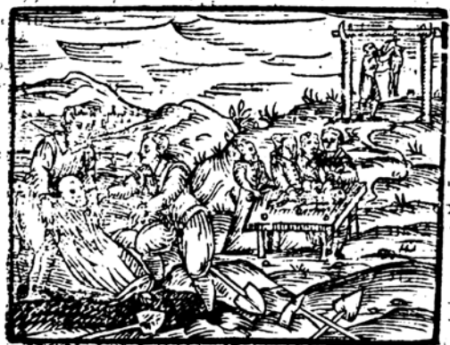
Brujos desenterrando un cadáver Compendium Maleficarum (Francesco Maria Guazzo, ed. 1626, fol. 149).

Tanto en las descripciones de Mongastón como en las de Guazzo sobre la necrofilia satánica de los brujos, no es difícil percibir las amenazas que pesan sobre los que se acercan de noche a los cementerios 79 . El problema