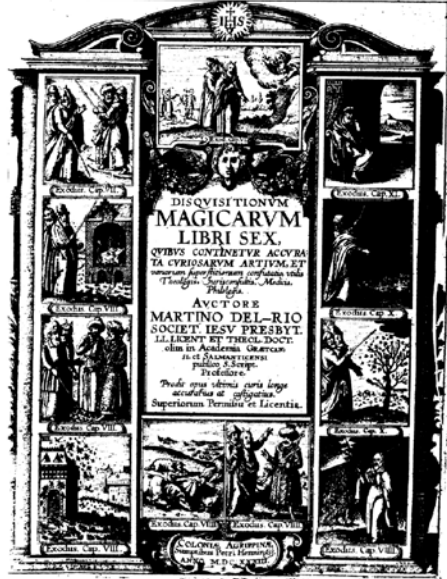
Portadas de Les ruses, finesesses et impostures des espritz malins (Robert du Triez, ed. 1563) y Disquisitionum magicarum Libri Sex (Martín del Río, ed. 1633).

A CAMBRAY. Par Nicolas Lombart Imprimeur. Avec grace & Priuilege. An. 1563.