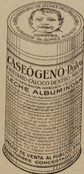
Envase de lata del nuevo producto en polvo CASEÓGENO

Es libro popularísimo en Inglaterra, y de él se han publicado 10 ediciones, que alcanzan a 148.000 ejemplares. Este es su mayor elogio. Confiamos que la edición española será el mejor con sejero de todos los que utilizan el Ford, tanto en España como en América.