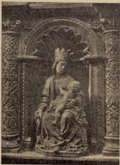
Nuestra Señora de la Leche

Escultura antigua de artístico mérito existente en la Catedral de Sigüenza