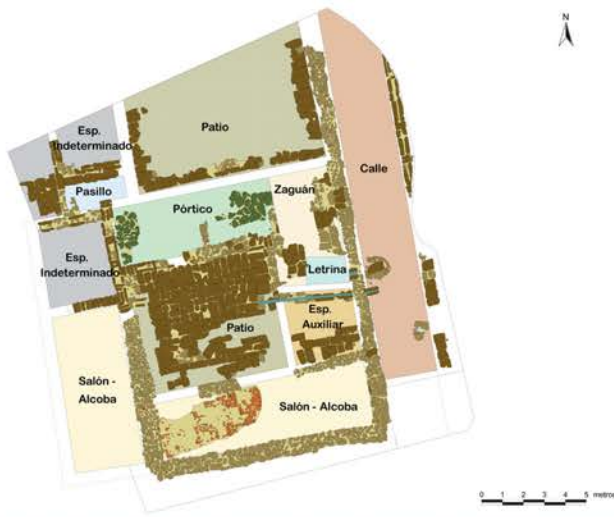
Planimetría de usos y funciones en su fase Medieval

La actual Avenida del Brillante tiene su origen en la vía romana que comunicaba Córdoba con Sierra Morena, o lo que es lo mismo, con la zona minera del Norte, base de la riqueza de la ciudad y de sus elites. En este entorno es frecuente la localización de villas agropecuarias o residencias de lujo, industrias alfareras y, sobre todo, áreas de enterramiento. Es una constante el hallazgo de ustrina (estructuras para la cremación de los cadáveres), monumentos funerarios de gran porte y sencillos enterramientos de la más variada tipología.