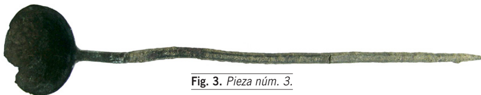
Fig. 3. Pieza núm. 3.