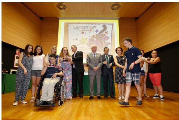
Nota de prensa Concurso Escolar de la ONCE