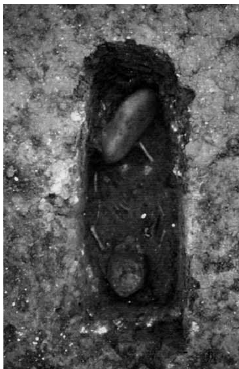
LÁM. IV. Enterramiento infantil, de Emerita Augusta, sobre cuyas rodillas se dispuso una piedra de considerables dimensiones. (Márquez Pérez, 2002, lám. 4).

En la necrópolis de Granollers , Barcelona (TENAS I BUSQUETS, 1991-1992, 67-79), los restos funerarios se distribuyen en dos ámbitos diferenciados: un sector de 350 metros cuadrados de superficie dedicado al enterramiento de personas con edad que oscilaban entre los 5 y 6 años y una fosa de grandes dimensiones, de 165 metros cuadrados de superficie y una profundidad de 1'5 metros con respecto al nivel de las sepulturas, situada en el extremo oriental de la