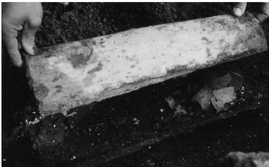
LÁM. III. Enterramiento infantil bajo imbrex. Necrópolis de Caesaraugusta. (Adiego, 1991, 28).

len ser muy elaboradas y, con frecuencia, el ajuar que los acompaña no es ni muy rico ni muy abundante.