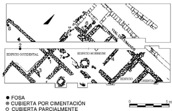
LÁM. II. Enterramientos subgrundales del Hort de Morand. Planimetría general (González, 2001, 331).

habían llegado a los 40 días de vida, ya que a falta de la dentición no podían quemarse, y, a su vez, la masa del cadáver no era suficiente como para formar un montículo, por lo que debía protegérseles con una estructura superior que a su vez les daba cobijo (GALVE, 2008, 156).