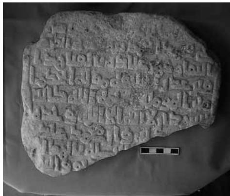
LÁMINA I. Detalle de la inscripción.

' Abbās (TORRES BALBÁS, 1985: 260-261; PINILLA, 1997: 199-200) ubicado extramuros de la zona oriental, fuera de la Bāb 'Abbās , lo que parece localizarla en el entorno de la actual 'Plaza de los Trinitarios', al final de la calle 'M. a Auxiliadora' (Fig. 1). En este cementerio, que registra enterramientos desde el año 234H/848 d.C. hasta el 622 H/1225 d.C., fueron enterrados personajes famosos: en él se hallaba, por ejemplo, la rawḍah o mausoleo de Averroes (ZANÓN, 1989: 87).