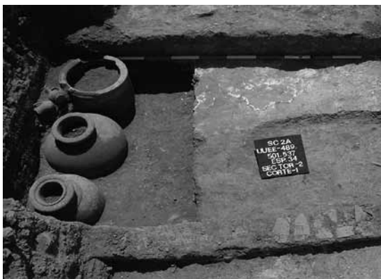
LÁMINA II. Contexto arqueológico en el que apareció la lápida reutilizada.