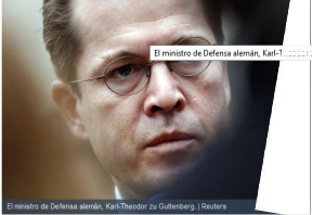
El ministro de Defensa alemán, Karl Theodor