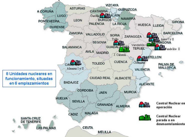
Fig. 1: Mapa de ubicación de centrales nucleares (Web del Ministerio de Industria, Energía y Turismo, 2014).

El presente trabajo se centra en la labor desempeñada por traductores e intérpretes profesionales en las centrales nucleares (CC.NN.) en España. En nuestro país contamos actualmente con seis CC.NN., todas ellas en la península, dos de las cuales disponen de 2 reactores cada una (Almaraz y Ascó), por lo que suman 8 unidades (reactores de agua ligera) 1 en un total de seis emplazamientos: