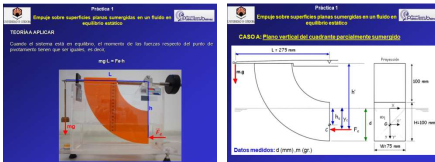
Figura 4. Práctica realizada en laboratorio con toma de datos

Durante el desarrollo de la práctica y en clases de teoría los alumnos han podido hacer preguntas concretas al profesor. Finalmente, y dentro del plazo establecido, cada alumno ha entregado un informe individual de la práctica realizada en el que se incluyen los datos tomados en laboratorio y los resultados obtenidos. Este informe se ha entregado como una tarea a través de la plataforma moodle.