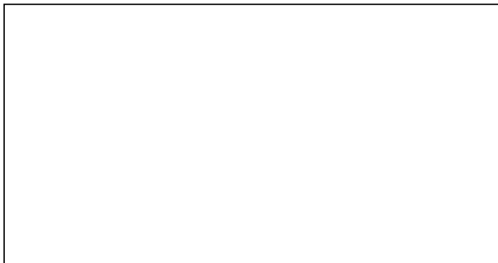
Figura 6. Plantilla de Excel entregada para resolución de problema

Igualmente en la asignatura IHASD los alumnos han resuelto un problema de red mallada mediante la realización de una hoja de cálculo. Para ello se le ha facilitado un problema resuelto, y una plantilla de Excel para ayudarles a crear la suya (Figura 6).