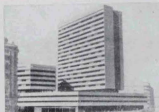
En construcción - MADRID