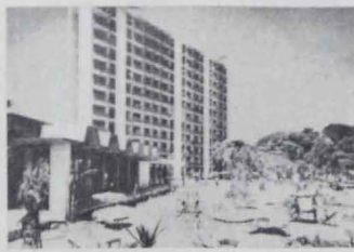
Apartotel Magaluf - MALLORCA