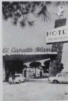
Motel El Caballo Blanco PTO. STA. MARIA