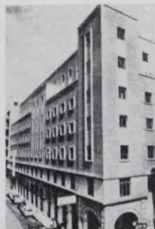
Hotel Nevada Palace GRANADA

Paseo del Rey, 12 MADRID-8 Oficina Central de Reservas Teléfono 2411845 Cables: CATELSA Telex: 758