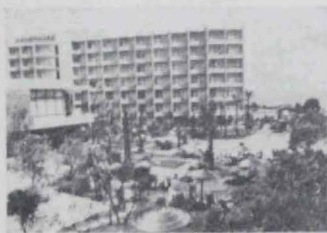
Hotel 3 Carabelas - TORREMOLINOS