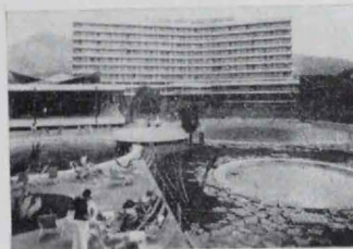
Hotel Don Pepe - MARBELLA