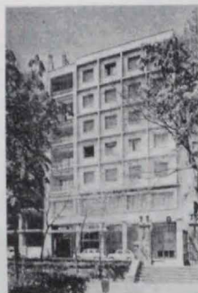
Hotel Alfonso VIII CUENCA