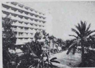
Hotel Bahía Palace - P. MALLORCA