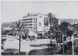
Hotel Córdoba Palace - CORDOBA