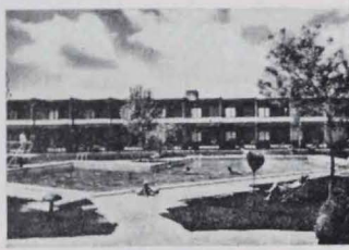
Motel El Hidalgo - VALDEPEÑAS