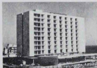
Apartotel Torrearm - TORREMOLINOS