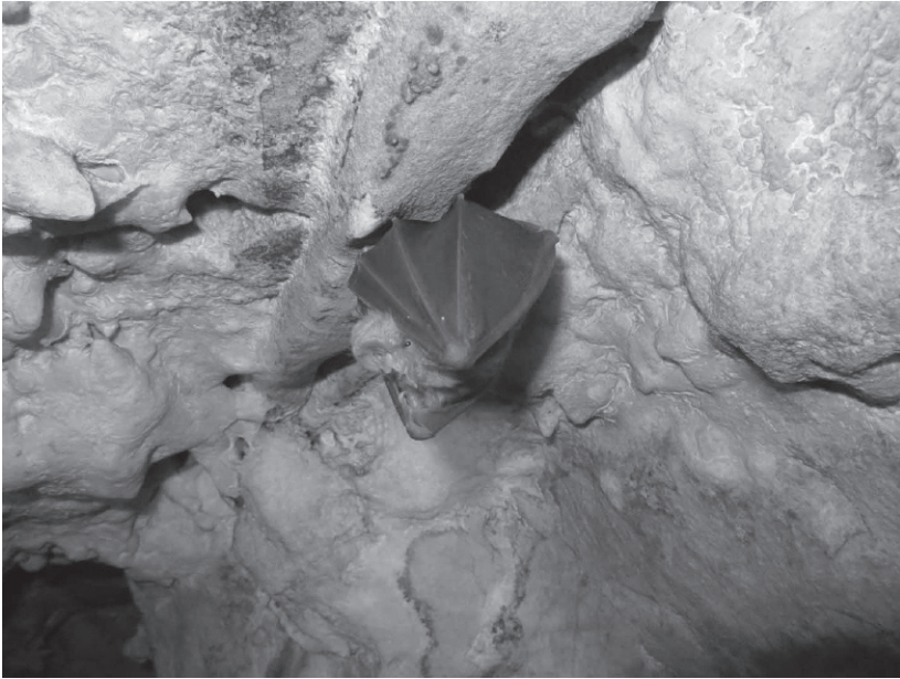
Figura 1. Rinolofa grande de herradura