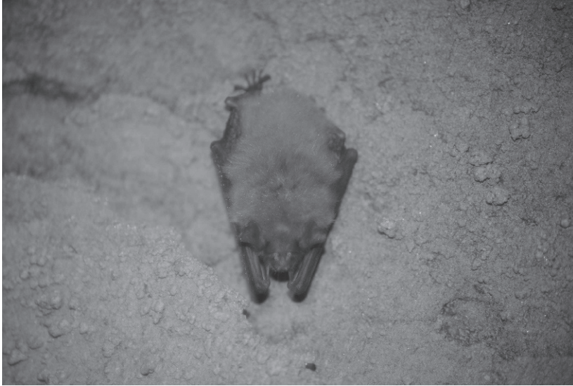
Figura 2. Murciélago ratonero mediano