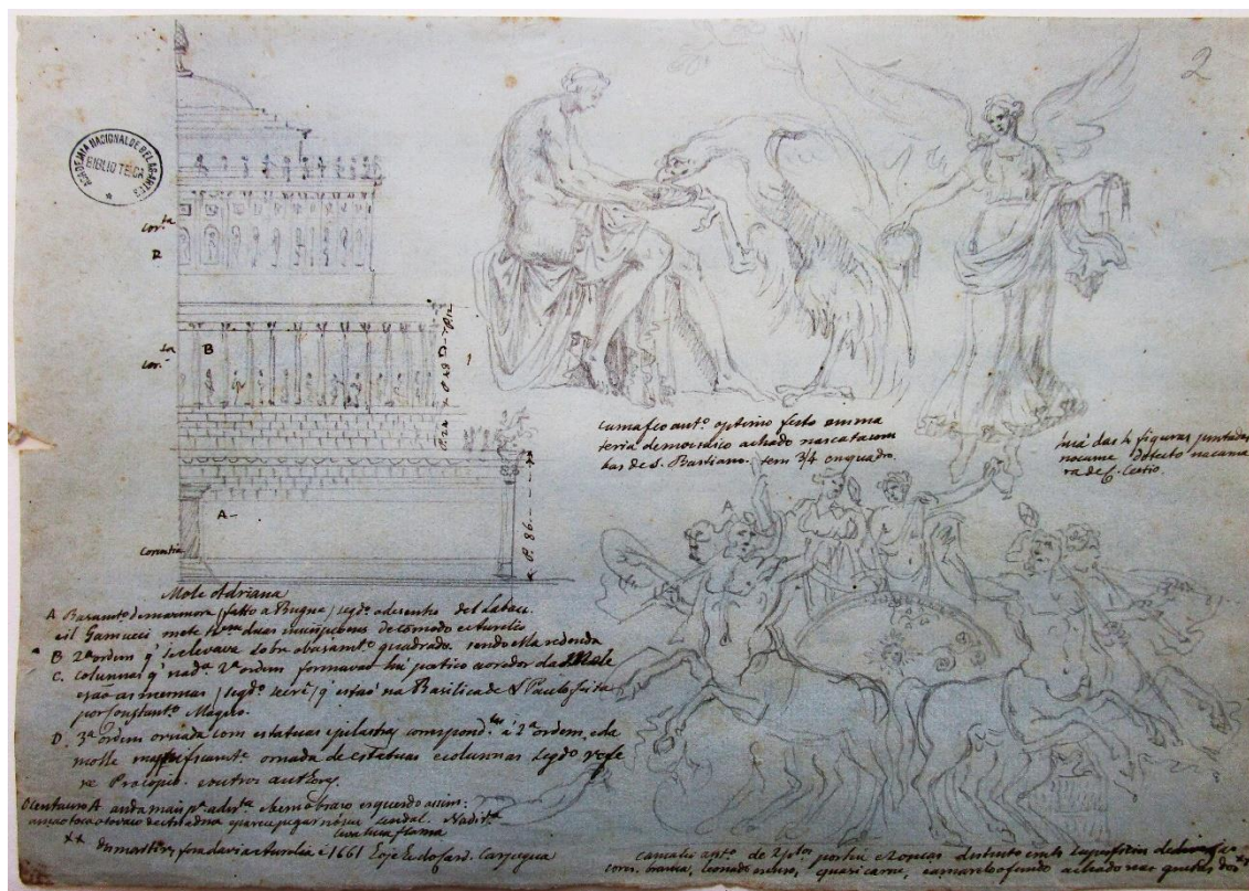
Fig. 6. Desenho, Cyrillo Volkmar Machado (sem data). Pasta Nº 12 – Descipção da pintura feita no Real Paço de Maфра na 1.ª antecâmara da parte do norte . Desenho a lápis com inscrições a tinta-da-china.

das suas obras de pintura, bem como definiram Rafael como o expoente máximo da perfeição em pintura.