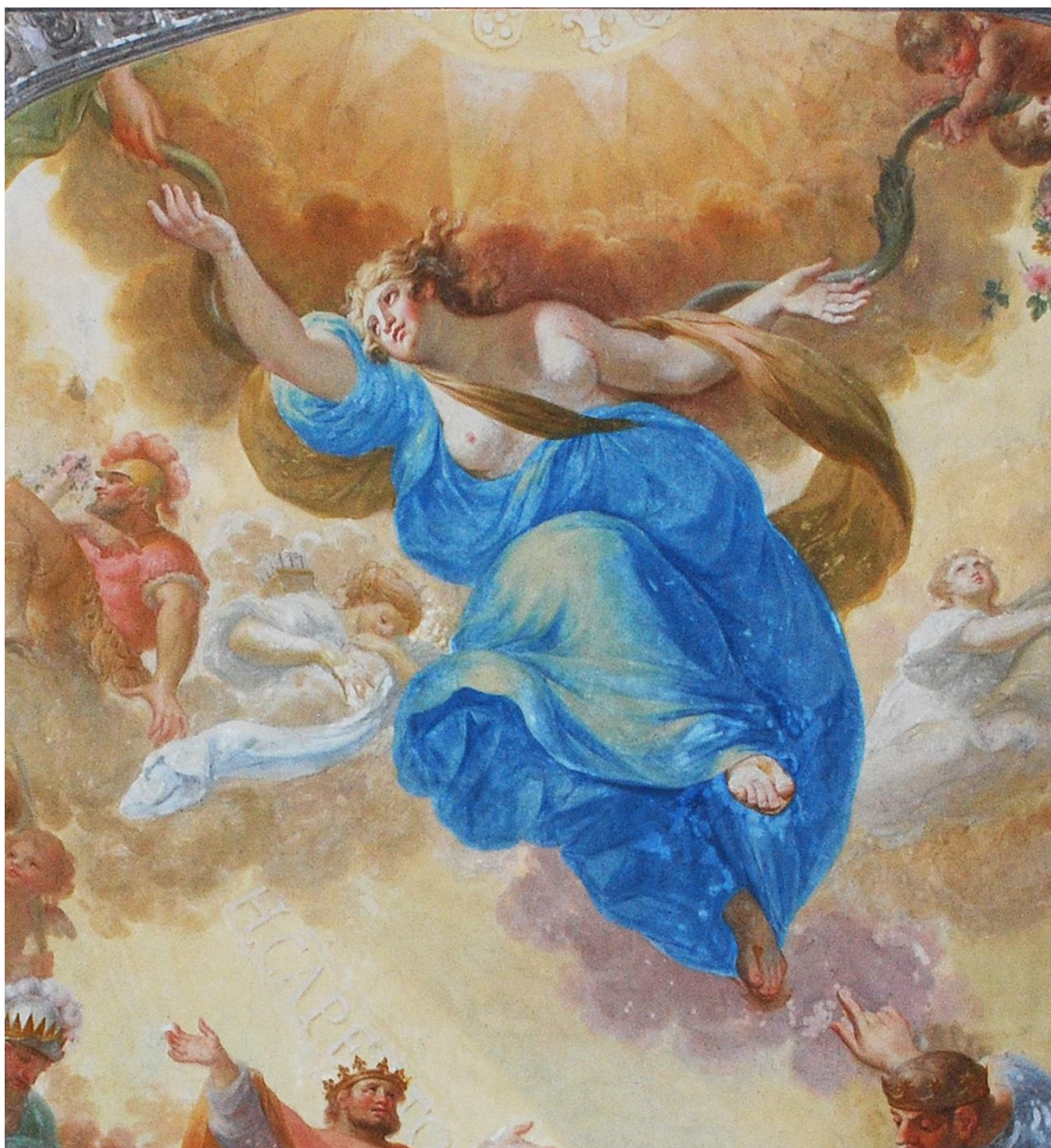
Fig. 3. Pintura, Cyrillo Volkmar Machado para o tecto da Sala dos Destinos, Palácio de Mafra (entre 1799 e 1800).

imagética. Na composição do casal de deuses Júpiter e Juno, que integra a pintura do tecto da Sala dos Camaristas do Palácio de Mafra (em 1797), Cyrillo inspirou-se nas famosas pinturas concebidas pelo representante do Barroco flamengo para Maria de Médicis. Cyrillo não foi também alheio à obra de Carlo Maratta (1625-1713), que segundo Giovanni Pietro Bellori, foi o «digno herdeiro de Rafael e Carracci» (Bellori, 2005: 10). Maratta foi por isso alvo das pesquisas cyrillianas.