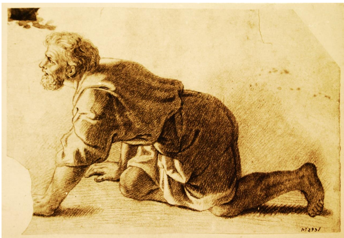
Fig. 1. Desenho , Cyrillo Volkmar Machado. Sem data. Localização: Museu Nacional de Arte Antiga, Lisboa. Nº inventario: 2931. Técnica: Desenho a sanguínea. Dimensões: 2,55×1,69 mm.

Cyrillo aderiu igualmente ao neo-seiscentismo francês, ou seja, revelava conhecimento da obra de Nicolas Poussin (1594-1665) e Charles Le Brun (1619-1690), bem como de outros artistas que se aproximaram da estética italiana classicizante, como por exemplo, Michel Corneille II (1642-1708). No anteriormente mencionado Palácio Porto Côvo, a figura de Mercúrio, que se apresenta no tecto da Sala das Visitas, foi executada com base na pintura de Michel Corneille II para uma das antecâmaras do Palácio Versalhes. Este artista francês foi seguidor da escola bolonhesa romana de base classicizante, cujo grande representante foi Annibale Carracci. No ciclo de pinturas do Palácio de Mafra, o tecto da Sala das Descobertas (executado em 1798) tem a presença de figuras esvoaçantes que se aproximam das concepções de Charles le Brun para o Palácio Versalhes. Ao nível da concepção gráfica, existe um desenho de figura (Fig. 1) feito por Cyrillo que é uma cópia da obra de Charles le Brun, A Adoração dos Pastores (de 1689). Como ele próprio refere nas Conversações : «se exceptuarmos Le Brun, Poussin, e alguns outros do seculo de Luís XIV, que seguirão o Antigo, e o gosto romano; em quasi todos achamos de ordinário mais espirito, que verdade, mais franqueza, que elegância, e correcção» (Machado, 1798:14)