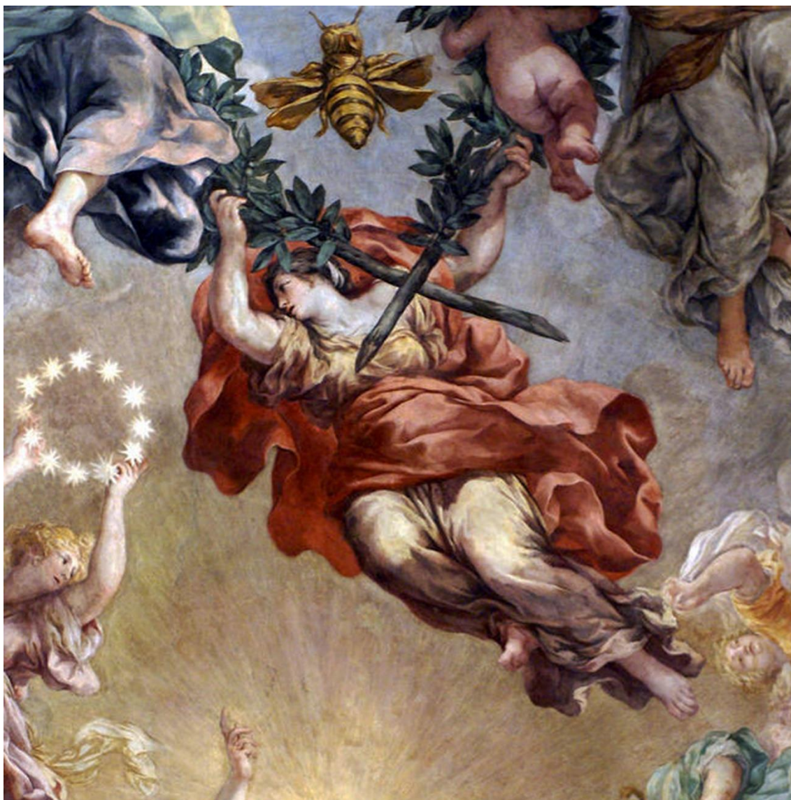
Fig. 2. Pormenor do tecto da pintura a fresco, Pietro Cortona, Triunfo da Divina Providência (entre 1632 e 1639). Palácio Barberini, Roma.