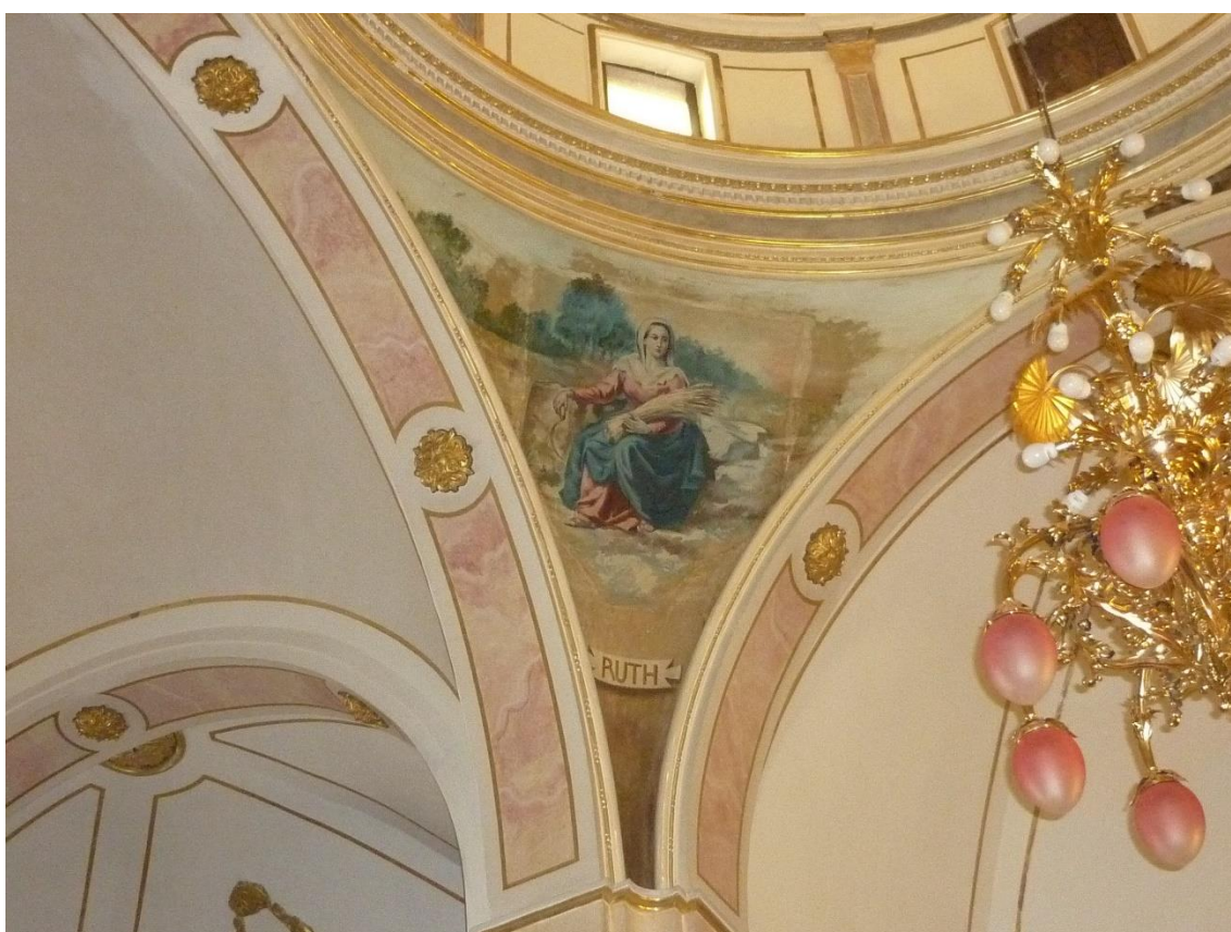
Fig. 6. Rut . Pechina de la cúpula del crucero, hacia 1925. Capilla de Nuestra Señora de la Fuente, Villalonga (Valencia).

Sentada sobre unas piedras y con la mirada perdida en el horizonte se nos muestra Rut. Va vestida con una túnica roja, un amplio manto azul oscuro, que envuelve parcialmente la mitad inferior de su cuerpo, unas sandalias y una toca blanca, bajo la cual oculta sus cabellos. En la mano derecha sostiene una hoz, mientras abraza un haz de espigas con el brazo izquierdo. Al fondo podemos apreciar una frondosa arboleda y unos campos de cultivo, así como un cielo amarillento que nos sitúa en el atardecer, cuando la jornada de siega ya ha finalizado (Fig. 6).