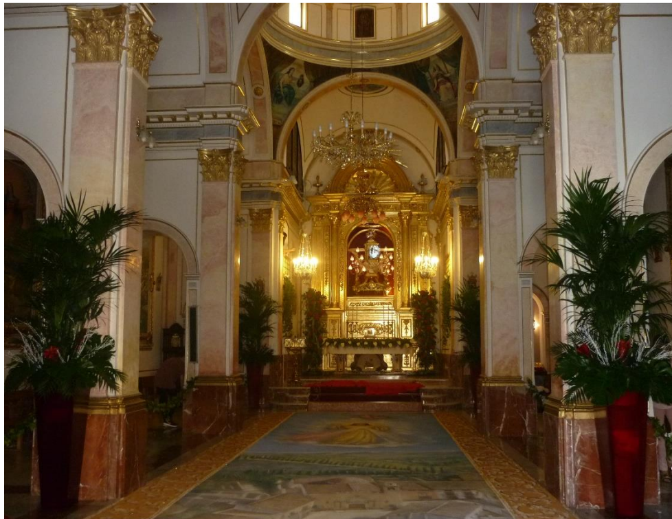
Fig. 4. Vista general del interior , 2016. Capilla de Nuestra Señora de la Fuente, Villalonga (Valencia). Foto: [JCM].