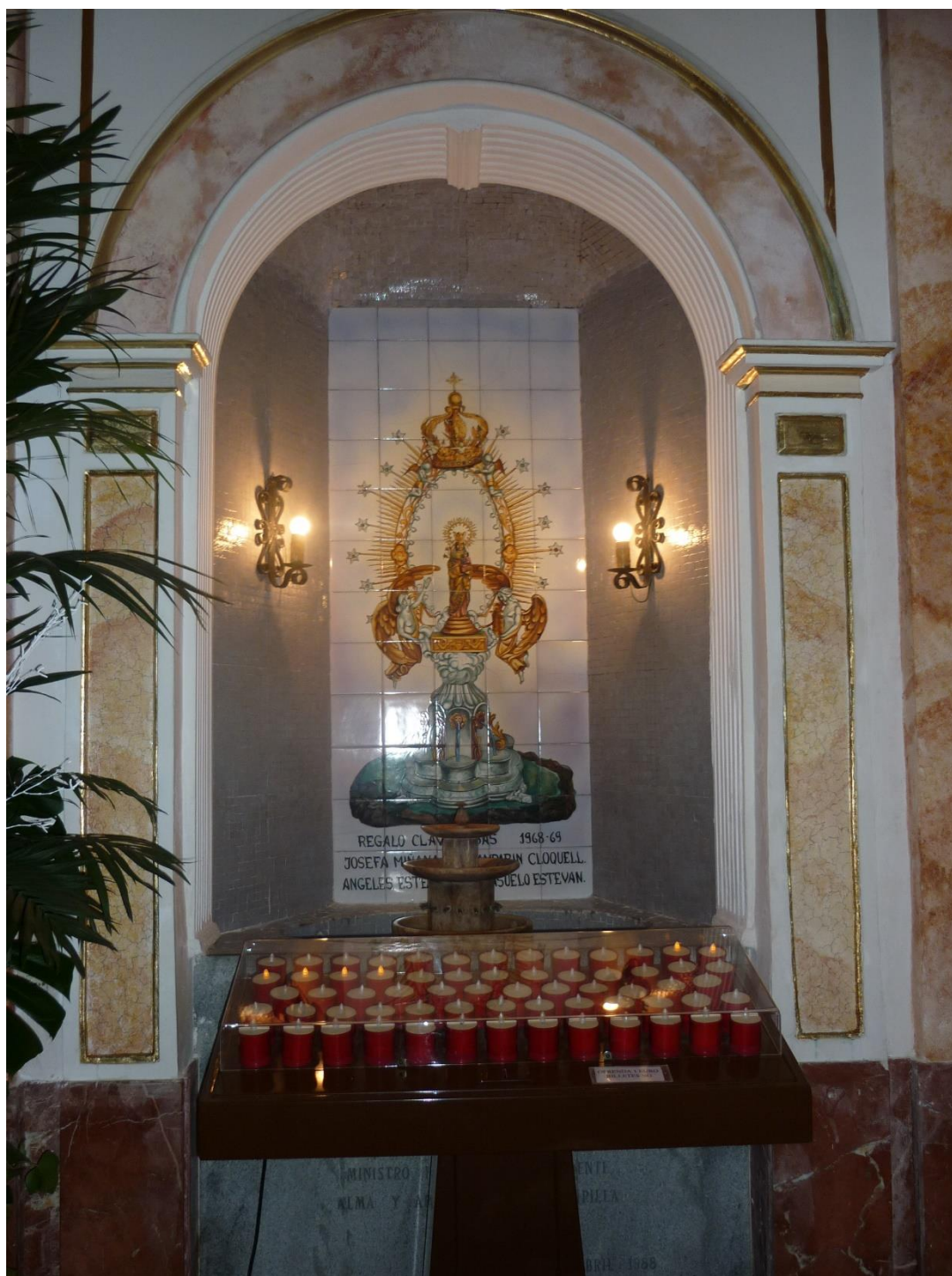
Fig. 10. Altar cerámico con la imagen de la Virgen de la Fuente, 1969. Capilla de Nuestra Señora de la Fuente, Villalonga (Valencia).

Fuixà, copia de Rafael (1504); y la Coronación de la Virgen , copia de un lienzo de Velázquez (1645), pintada por Vicent Estevan en 1957.