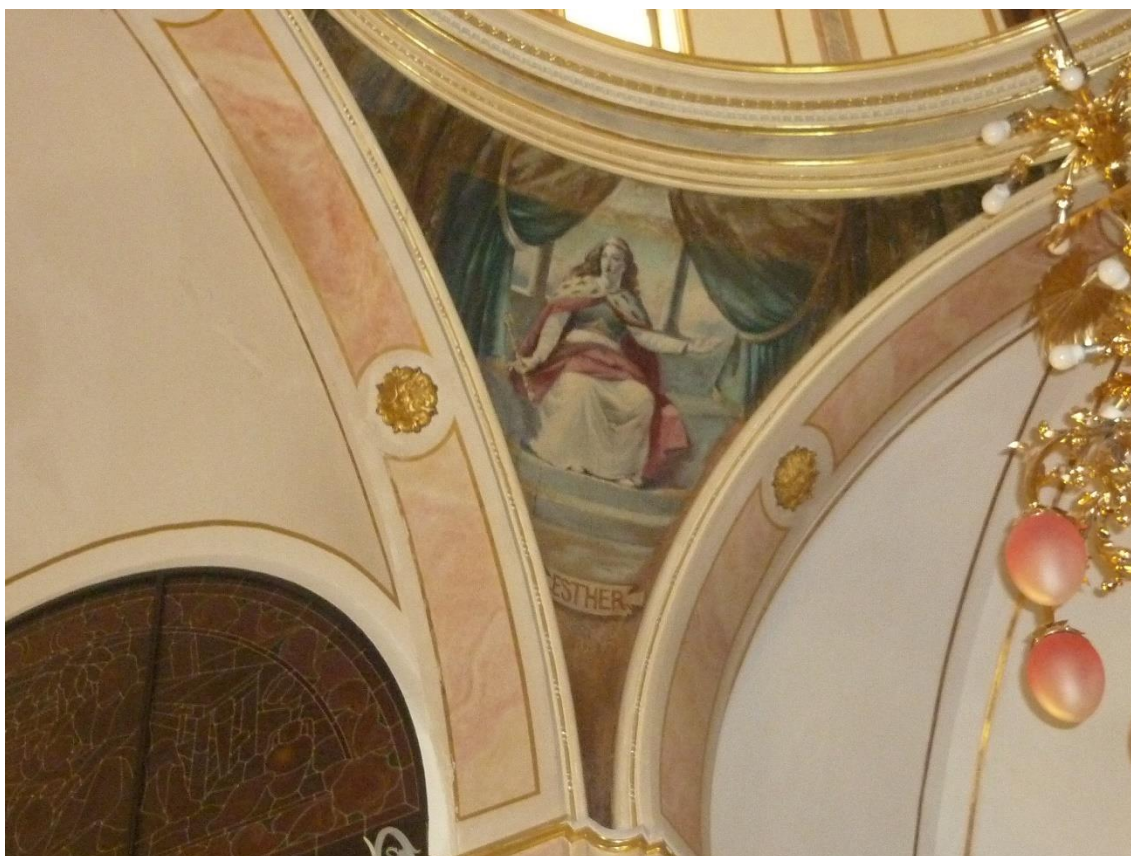
Fig. 5. Ester. Pechina de la cúpula del crucero , hacia 1925. Capilla de Nuestra Señora de la Fuente, Villalonga (Valencia).

Ester es representada como una joven de mejillas sonrosadas, con el cabello castaño y suelto, ornado con una diadema dorada, mirando hacia la izquierda del espectador. Está sentada en un poyo de piedra situado junto a una columnata, en lo alto de una escalera, sujetando delicadamente entre los dedos de su mano derecha el cetro dorado que la acredita como reina, mientras extiende la mano izquierda. Lleva una túnica blanca, una especie de corsé negro y dorado, y una capa roja forrada de armiño, que deja caer sobre su regazo. La escena queda enmarcada por unos cortinajes verdes y dorados que le otorgan una cierta teatralidad (Fig. 5).