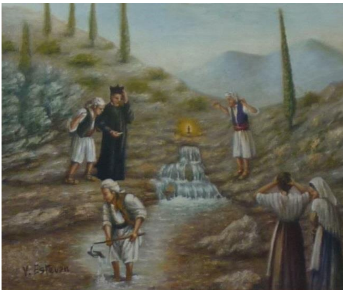
Fig. 1. Milagro de la Fuente , Vicent Estevan, 2007. Capilla de Nuestra Señora de la Fuente, Villalonga (Valencia).

En un principio fue venerada bajo la advocación de Nuestra Señora de la Salud, a raíz de las curaciones obradas durante una epidemia de peste acontecida en 1709, pero su título cambió en 1712. La sequía había hecho mella en la comarca y la fuente del pueblo había dejado de brotar, peligrando las cosechas y los rebaños. Viendo esto, Senén Pla ofreció la imagen y el rector del pueblo la colocó junto al manantial, brotando copiosamente las aguas, lo que fue considerado un milagro (Fig. 1). Ello propició la creación de una hornacina excavada en piedra, donde los vecinos de Villalonga la comenzaron a venerar como Virgen de la Fuente y la hicieron patrona.