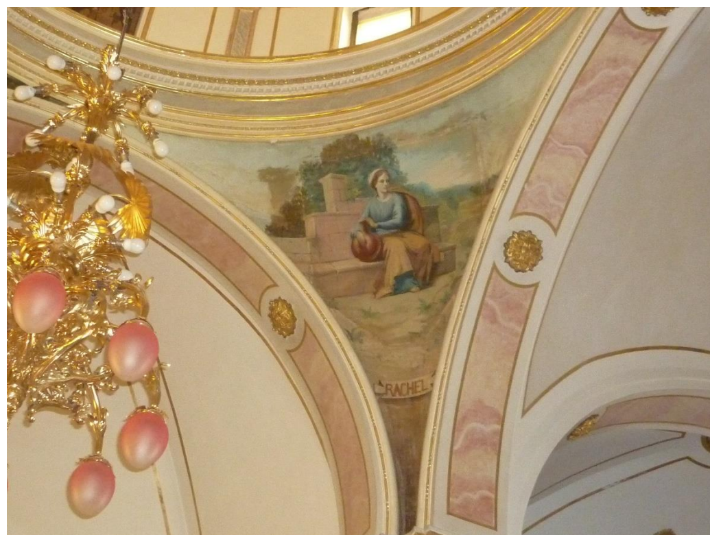
Fig. 8. Rebeca. Pechina de la cúpula del crucero, hacia 1925. Capilla de Nuestra Señora de la Fuente, Villalonga (Valencia).