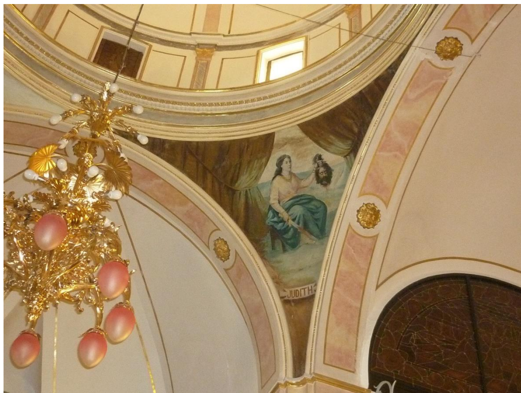
Fig. 7. Judit. Pechina de la cúpula del crucero, hacia 1925. Capilla de Nuestra Señora de la Fuente, Villalonga (Valencia).