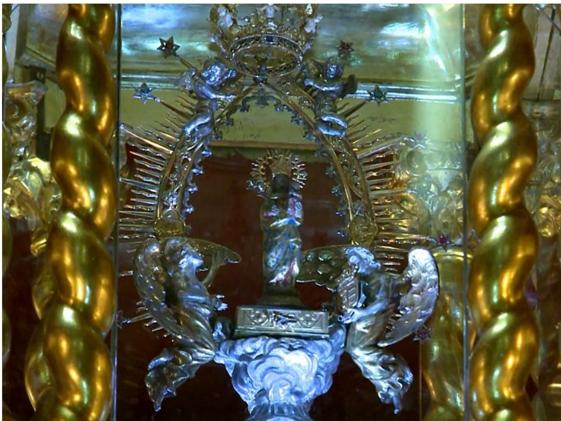
Fig. 9. Imagen de Nuestra Señora de la Fuente, finales del siglo XV. Capilla de Nuestra Señora de la Fuente, Villalonga (Valencia).