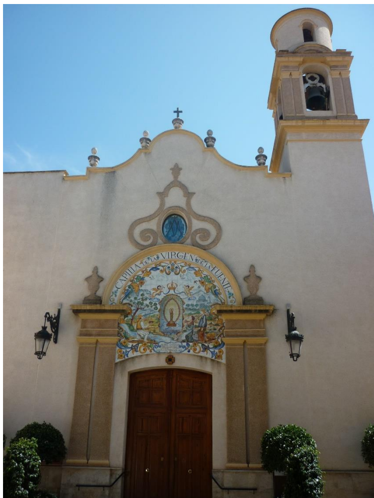
Fig. 2. Vista de la fachada , 1884. Capilla de Nuestra Señora de la Fuente, Villalonga (Valencia). Foto: [JCM].

dos parejas de pilastras que arrancan de un zócalo de piedra y sustentan un sencillo entablamento partido, con dos macetas ornamentales sobre la cornisa. Sobre el dintel de la puerta se yergue un frontón cerámico con una escena campestre alusiva al hallazgo de la Virgen por Senén Pla, que fue regalado por las Clavariesas de 1986 33 (Fig. 3). En cuanto a la torre, que se levanta adosada en la parte derecha, tiene tres alturas. El cuerpo de campanas se articula con pilastras dobles y tiene un frontón curvo sobre el entablamento, mientras que el remate es cilíndrico y se encuentra desornamentado (Montolio y Ronda, 2010: s/p) 34 .