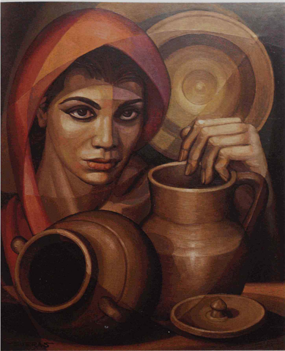
«Vendedora de vasijas»