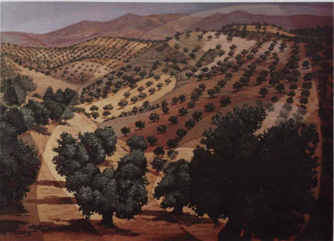
«Campos de Andalucía»