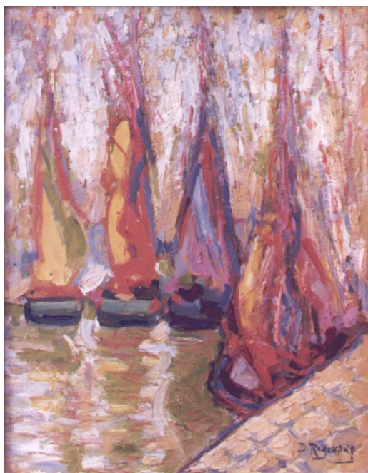
Fig. 3. Velas de Oriente (h. 1920), Dimitri Regevsky, Óleo sobre lienzo, (DOMUS: CE2512P)

En esta época el Museo de Bellas Artes de Córdoba sigue recibiendo numerosas donaciones gracias a los contactos de Enrique y de su hermano Julio. Entre ellas el Retrato de Hombre (1902) del valenciano Manuel Benedito Vives (1875-1963), obra donada en 1917, seguramente en una visita de Enrique a Madrid. Posteriormente, la celebración en 1919 de la primera exposición individual de Julio Romero de Torres en el Majestic Hall de Bilbao, favorecería que los hermanos crearan contactos con los artistas e intelectuales vascos contemporáneos, como fue el caso de Quintín de Torre Berastegui (1877-1966), quien por la amistad que le unía a Julio dona para la Sección de Arte Moderno su obra Cargador del muelle de Bilbao , una escayola modelada en 1906, que muestra un personaje masculino, de fuerte musculatura, representado de pie y ataviado con la ropa de trabajo, siendo buen exponente del característico interés de Torre durante su primera etapa por la clase popular y trabajadora 36 . A partir de la mencionada exposición de Julio Romero, se recibieron otras donaciones para el museo, como la del pintor ruso Dimitri Regevsky, quien en 1920 donó el lienzo titulado Velas de Oriente , una marina con barcos 37 -temática muy popular de la época- realizada con una pincelada suelta y pastosa con la que entremezcla las tonalidades. Se trata de una pieza que se pone en relación con tendencias artísticas francesas como el impresionismo y con maestros fauvistas como André Derain.