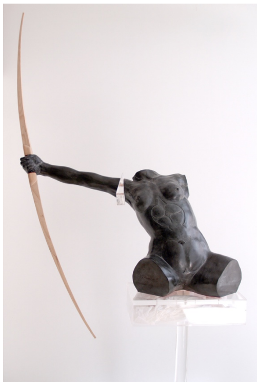
Fig. 11. Artemisa despojada del chándal (2016), Juan Zafra, Terracota y Metacrilato, (DOMUS: DO0203E)

temática social, así como de un dibujo realizado en grafito, Mujer de espaldas (1982), con una temática más calmada 76 . Por otra parte, en 2013 el artista Pepe Duarte deposita en el museo un lienzo de 1981, donde se puede contemplar a dos mujeres semidesnudas situadas en una arquitectura aislada, todo realizado mediante colores planos y vibrantes. Este depósito fue aceptado por la Junta de Andalucía en el 2014.