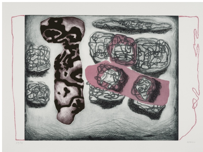
Fig. 8. Yo recuerdo que... (1985), Luis Gordillo, Lápiz sobre papel, DJ0105G

A estos fondos se le añade la donación del posterior director del museo, José María Palencia Cerezo, de un guache y grafito en 2003 -aceptado mediante Orden de la Consejería de Cultura de 7 de septiembre de 2004-, una interesante obra realizada tanto en el anverso como en el reverso, ejecutada en 1959. Por último, en 2004 la Junta de Andalucía adquiere el dibujo Pinocchio (1988) del cordobés Pepe Espaliú (1955-1993) a la casa de subastas Segre de Madrid. A pesar de las numerosas propuestas del museo, solo se ha conseguido este boceto a carboncillo y sanguina, realizado para una serie de 16 obras. A pesar de ser un pequeño boceto, la huella de Espaliú está presente a través del simbolismo, el juego de lo oculto y la doble identidad 64 .