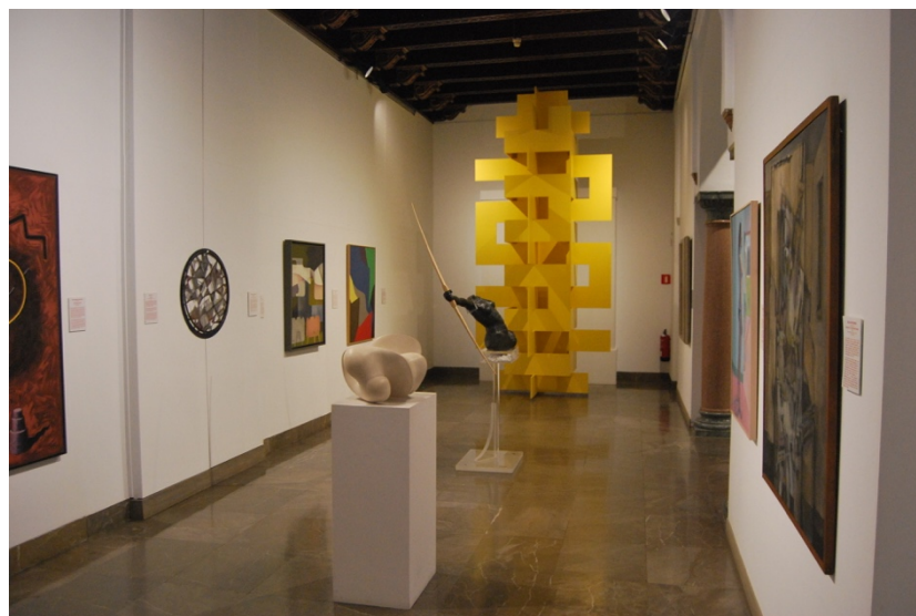
Fig. 9. Sala VI, “Arte Cordobés del siglo XX” del Museo de Bellas Artes de Córdoba

lápiz acuarelable, titulados El Caminante y Máscaras . Y del extremeño Juan Galea Barjola (1919-2004), se recogen dos aguafuertes denominados Camarín y Palco 67 .