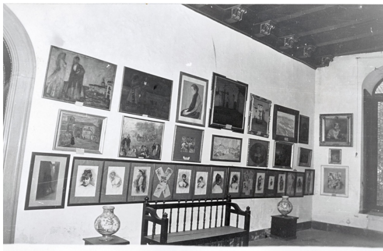
Fig. 1. Sala A. Sección de Arte Moderno del Museo de Bellas Artes de Córdoba, hacia 1980 (Facilitado por el Museo de Bellas Artes de Córdoba).

marcados por el Plan Museológico, se proponen piezas que tengan un valor histórico, artístico y documental y, además, que sean representativas del panorama cultural cordobés y andaluz. La institución museística al incrementar sus fondos debe plantear un discurso razonado, seleccionando las piezas con un juicio de valor y que doten a la colección de coherencia. Sin embargo, este acrecentamiento se convierte en una difícil tarea por la limitada disponibilidad de recursos económicos, por la falta de espacio en el edificio y por instalaciones que no permiten el idóneo desarrollo del museo 18 .