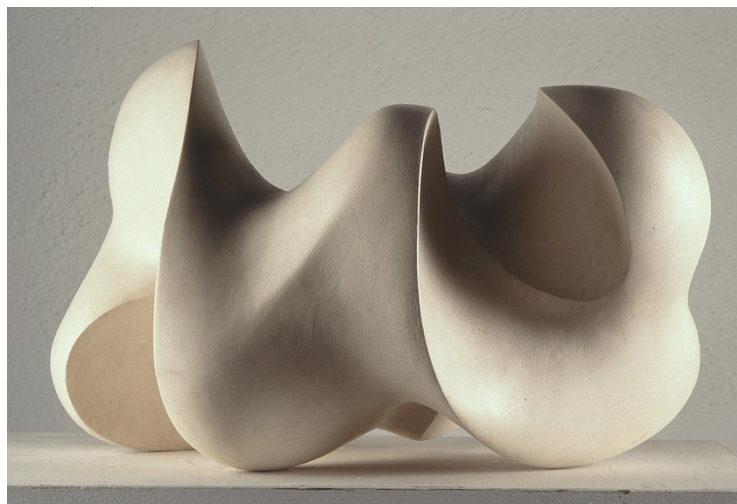
Fig. 7. S/T (1961), Equipo 57, Piedra, (DOMUS: DJ0032E)

pájaros , dos lienzos abstractos y coloristas pertenecientes a su última época, donde comienza a realizar las composiciones a base de texturas.