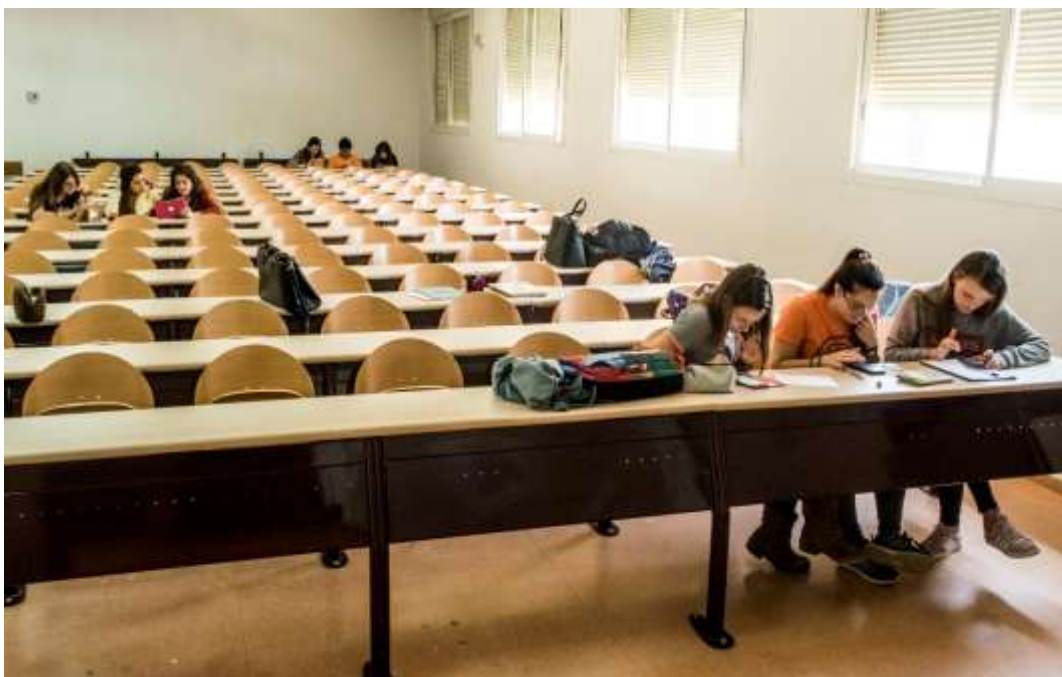
Figura 3. Alumnos separados en subgrupos para la práctica.

Tras una concisa explicación de la mecánica de la práctica, los alumnos dispusieron de 10 minutos para completar la anamnesis en un juego de roles donde el profesor actuaba como un ganadero que llamaba por teléfono al verse afectado por un brote en su explotación y los alumnos actuaban como veterinarios con la intención de recabar información. Tras esta fase, el grupo se subdividió en tres grupos de cuatro alumnos, que se separaron en puntos distantes de la clase (figura 3). Estos debían realizar un exhaustivo diagnóstico diferencial y, con objeto de alcanzar un diagnóstico asertivo, solicitar pruebas laboratoriales, con un límite de cuatro. Cuando decidían la prueba a realizar, llamaban al profesor, que actuaba como laboratorio, y especificaban la muestra enviada y el test solicitado, dándole el profesor el resultado. Para reflejar la sensibilidad y especificidad de cada técnica, el profesor tiraba en secreto un dado porcentual (figura 4), dando un resultado de falso positivo o negativo si el resultado de la tirada era superior a la especificidad / sensibilidad, respectivamente.