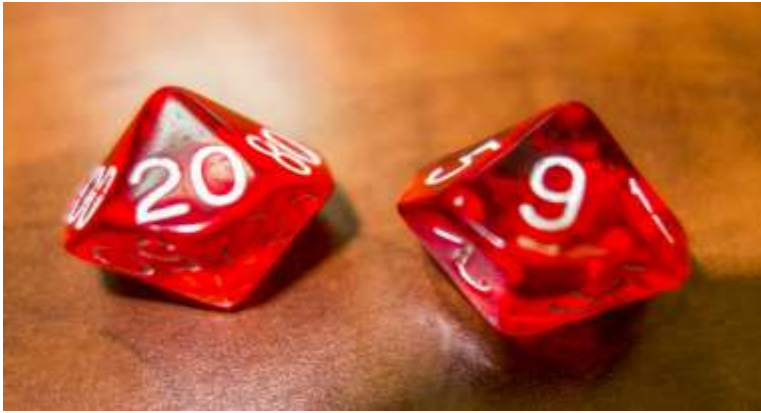
Figura 4. Dados porcentuales empleado para determinar la ocurrencia de falsos positivos/falsos negativos.

Finalizado el tiempo de que disponían para esta parte (30 minutos), algunos grupos llegaron al diagnóstico correcto y otros no. A continuación, el profesor realizaba una introducción al uso de algoritmos como herramienta de apoyo y les facilitaba los algoritmos creados para las enfermedades respiratorias y digestivas porcinas, dejando cinco minutos para usarlo. Transcurrido este tiempo, se volvían a reunir todos los grupos, se analizaba en conjunto la práctica, enfatizando en la utilidad (o no) de los algoritmos facilitados y, para finalizar, se les pasó una breve encuesta sobre qué les había parecido la práctica en general y el uso de los algoritmos en particular.