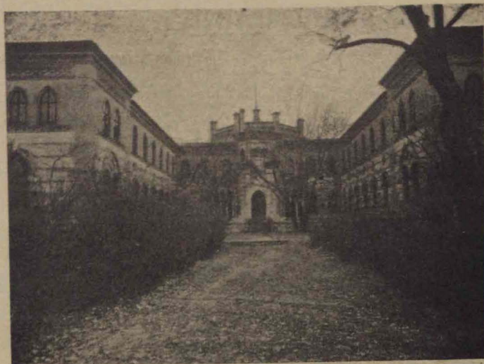
Vista exterior del internado.