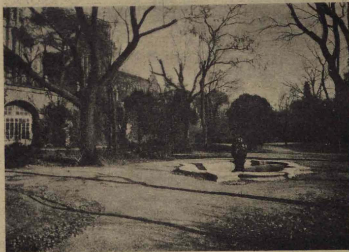
Un aspecto del jardín

guiendo los dictados de su conciencia independiente. La instrucción no sufre con ello lo más mínimo; por el contrario, tal libertad contribuye a vigorizar la voluntad del alumno y aplicarse al estudio con un fervor no habitual, guiado en todo momento por los catedráticos del Instituto.