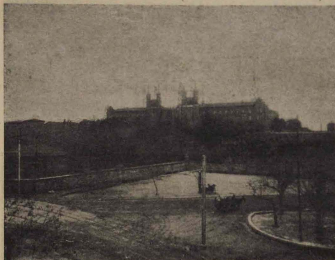
Vista general del Instituto Antonio Nebrija

El Instituto de Antonio de Nebrija, instalado en un suntuoso edificio que