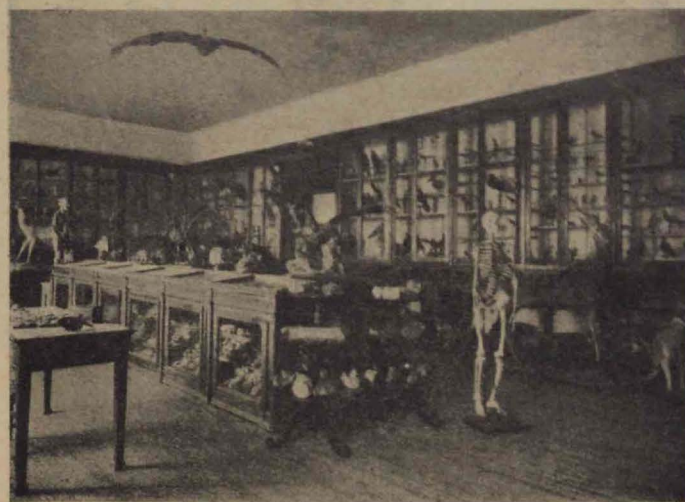
Museo de Historia Natural

Todo esto se complementa con las excursiones que frecuentemente se