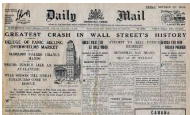
Ilustración 2. El crash de Wall Street, 1929.