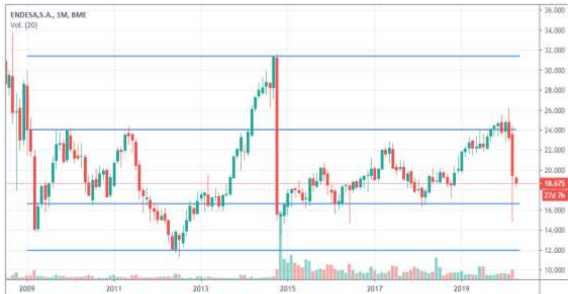
Figura 3. Soportes y resistencias

Como tercer elemento importante encontramos los soportes y resistencias 37 , son términos que se utilizan para denominar a niveles de precios determinados y entre ambos limitan el rango de movimiento del mercado. Es decir, el nivel de soporte se establece donde el precio deja de bajar regularmente y vuelve a subir, mientras que el nivel de resistencia donde el precio normalmente deja de subir y vuelve a bajar.