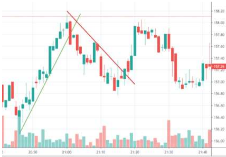
Figura 2. Ejemplo de tendencias