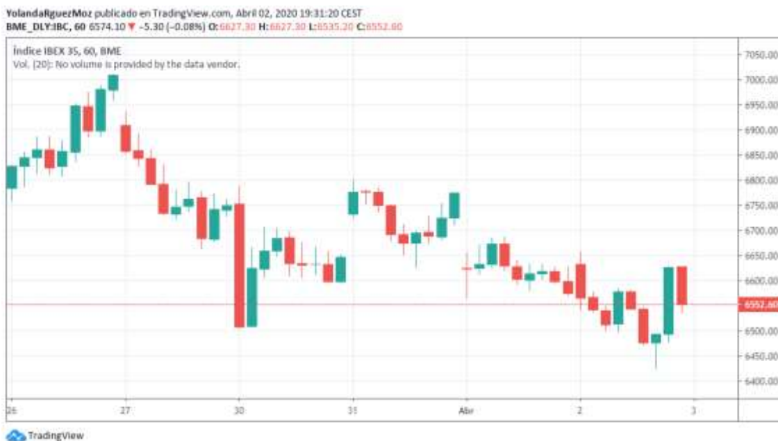
Figura 1. Ejemplo de un gráfico de velas

Desde un punto de vista más práctico vamos a desarrollar los elementos que deben considerarse para realizar el análisis gráfico. En primer lugar, es necesario saber que tipos de gráficos se utilizan para llevar a cabo el análisis técnico, y estos son el gráfico de líneas, de barras y de velas o Candelstick 34 . Nosotros nos centraremos en este último, dado que en nuestra opinión es el que más información suministra.