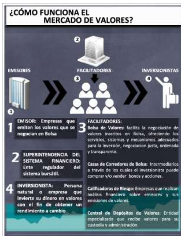
Ilustración 3. Funcionamiento del mercado de valores.

La negociación de los títulos valores entre el demandante de dinero (vendedor) y el oferente de dinero (comprador) sólo se puede realizar a través de un intermediario (corredor o agente de bolsa), quien se encarga de realizar las transacciones de compraventa. Por tanto, el vendedor y el comprador de títulos valores no pueden negociarlos directamente. Para que pueda comprenderse de forma más sencilla, la ilustración siguiente muestra las figuras que intervienen en el funcionamiento del mercado de valores.