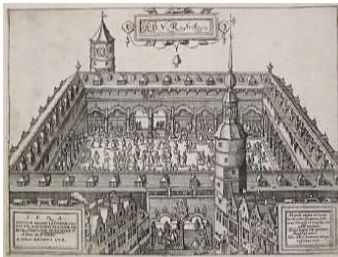
Ilustración 1. Mansión de la familia Van Der Buërse.

Así, en los años siguientes nacieron en ciudades como Amberes y Gante varios “bolsas” donde mercaderes de distintas nacionalidades cotizaban sus objetos de valor. Por ello, algunos estudios apuntan como la primera bolsa la creada en Amberes hacia el año 1531.