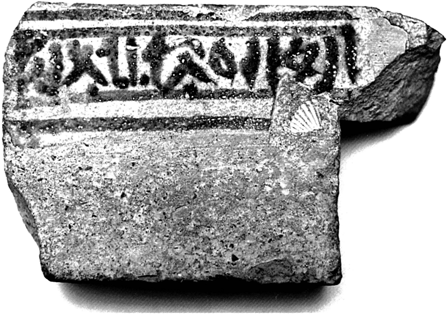
LÁM. II: Ladrillo funerario típicamente nazarí-meriní

cabecera de un pequeño distrito campesino de la Campiña cordobesa en el período omeya. Sin entrar a valorar otras circunstancias de carácter historiográfico o arqueológico, sólo recordamos que aparece citado con una extraña forma de Qanḡīt 28 en Ibn Ḥayyān ( Muqtabis , II, 1: 89r o , 90r o y 90v; trad. VALLVÉ y RUIZ GIRELA, 2003: 95, nota 24, 101, 104), y con las más usuales de Qānīt en al-Muqaddasī ( Aḥsan al-taqāsīm : 193), Qanīt/Qannīt en al-'Uḍrī ( Tarṣī' al-aḡbār : 3 y 89) y Qanūt/Qannūt en al-Qabtawrī ( Rasā'il al-dīwāniyya , III, 76-85; MANZANO RODRÍGUEZ, 1992: 50-51).