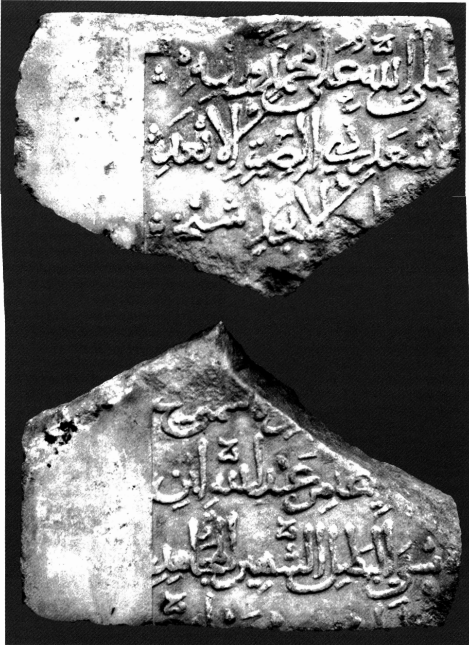
LÁM. I: Inscripción hallada en el Castillo de Cañete