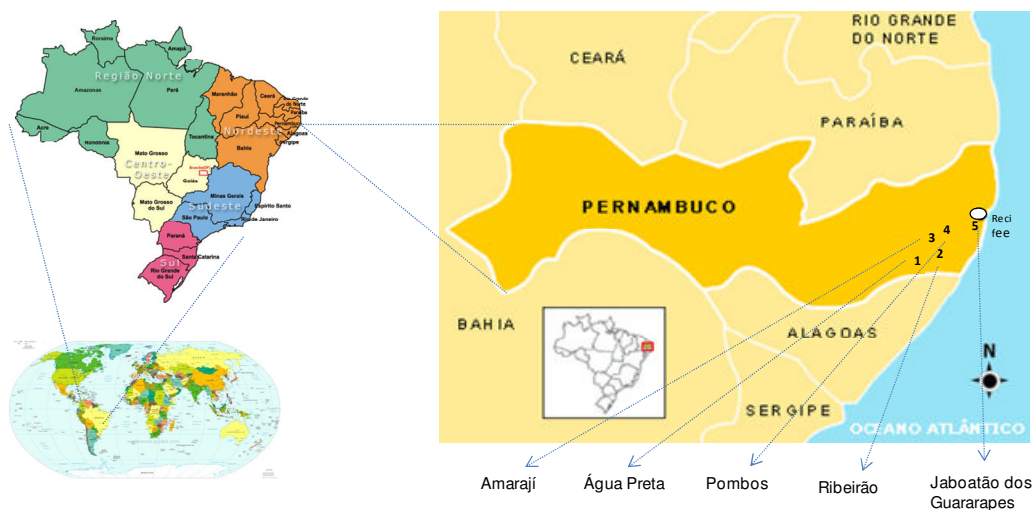
Figura 1. Ubicación gráfica del nordeste brasileiro y de la zona de estudio