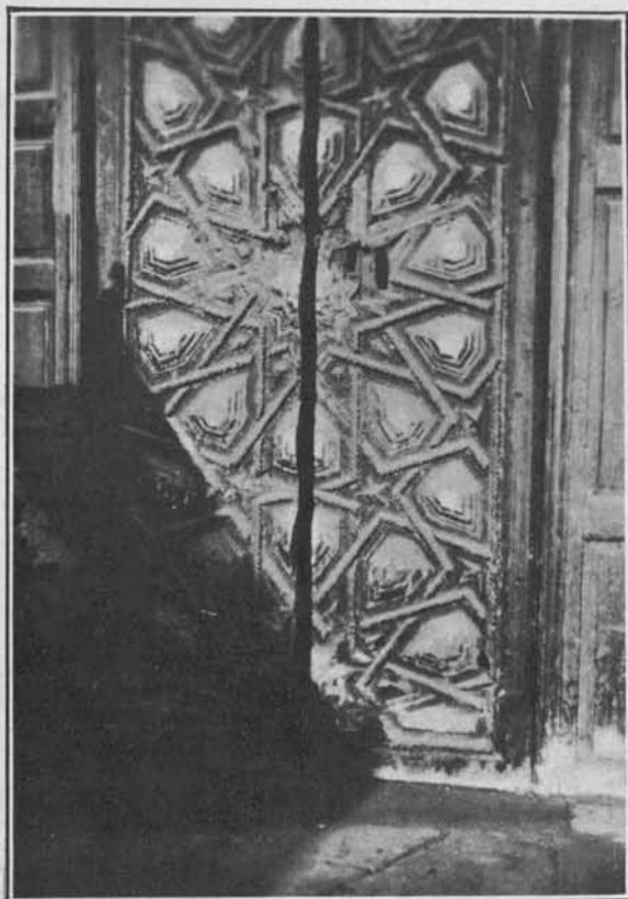
Bellísima puertecita de lacería mudéjar, conservando su policromía original, que existe en la iglesia de Santa Eufemia

Se conserva en el pueblo la tradición de que parte de los artesanos del castillo se emplearon en la iglesia, y, efectivamente, a los pies de ella hay dos espléndidos tableros, de vivos dorados, que destacan del resto de la techumbre, y que segura-