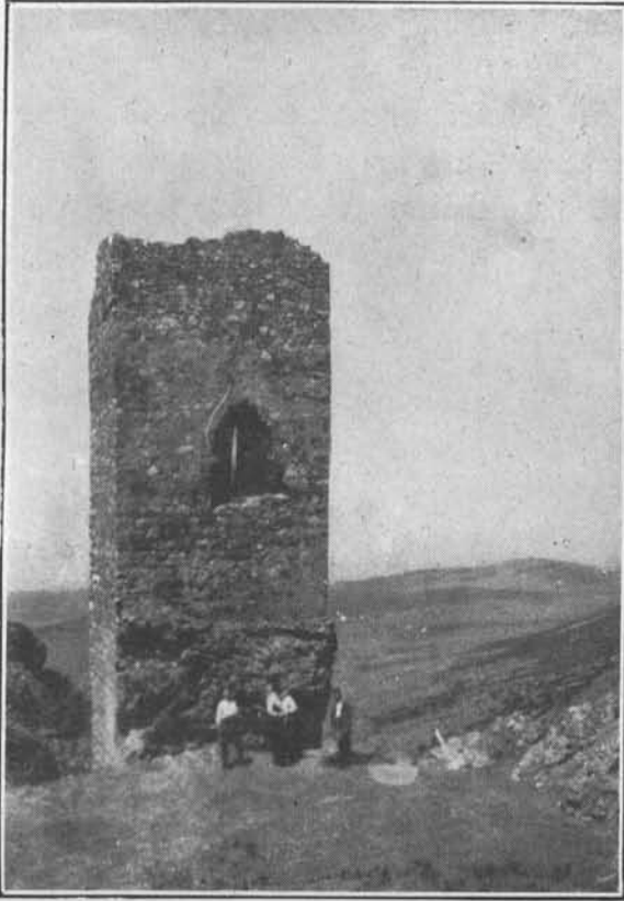
Torre del recinto del Castillo de Miramontes, acaso la del Homenaje