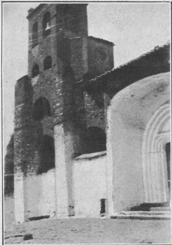
Portada y campanario de la iglesia parroquial de Santa Eufemia